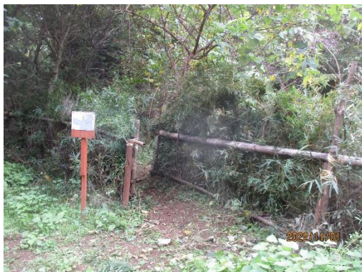
南側境界竹柵補修状況