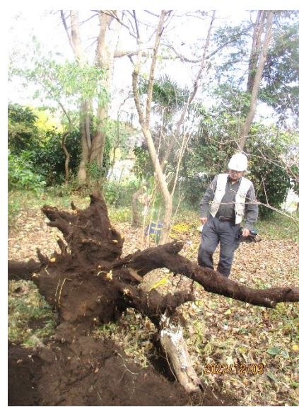
↑ウインチで引き起こし成功