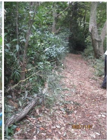
通路整備の様子(奥舞台)