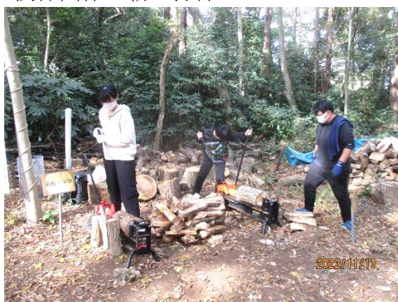
千葉大生も貢献 薪割り体験コーナー