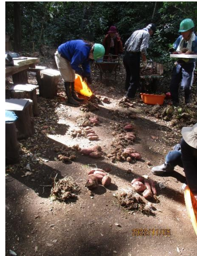
収穫物の剪定と山分け