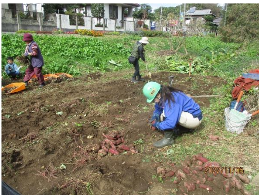
思い思いの作業(例の家族対応も)