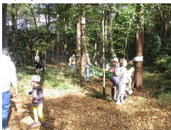
ハンモック、スラクラインの賑わい