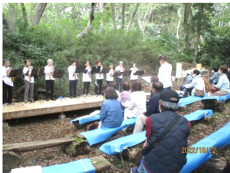
コカリナサークル森の音