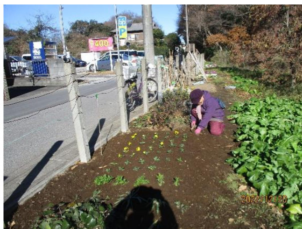
昨日植え付けたパンジーの定植