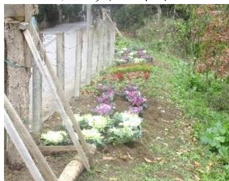
花壇（作業後の様子）