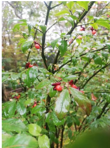
作業広場北側で実をつけていた