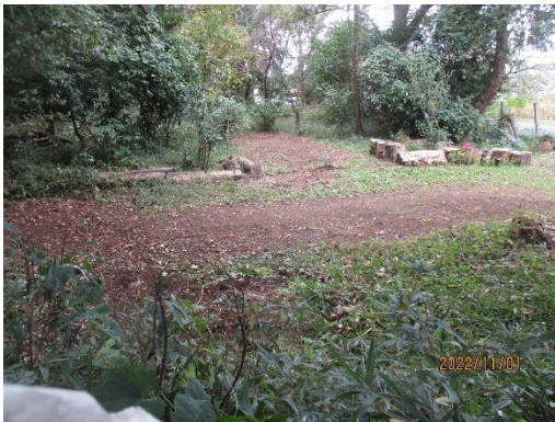
入口広場現況キッチンカー配備予定