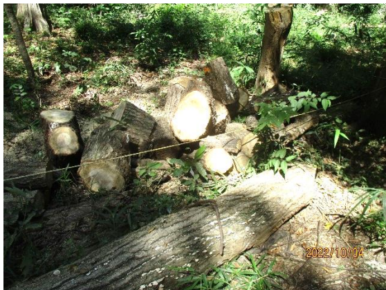
ナラ枯れ材の玉切