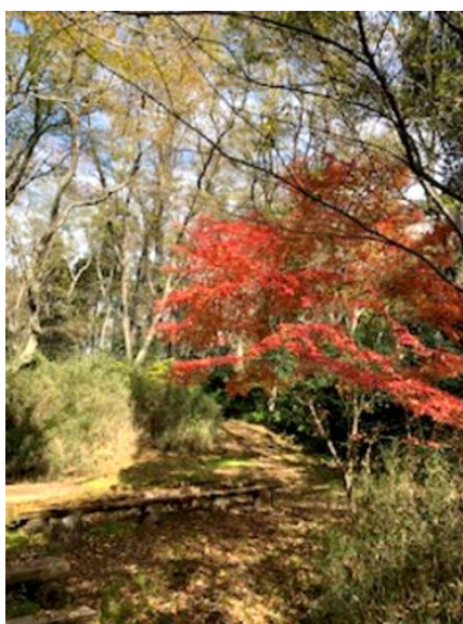
ステージ後方のカエデ