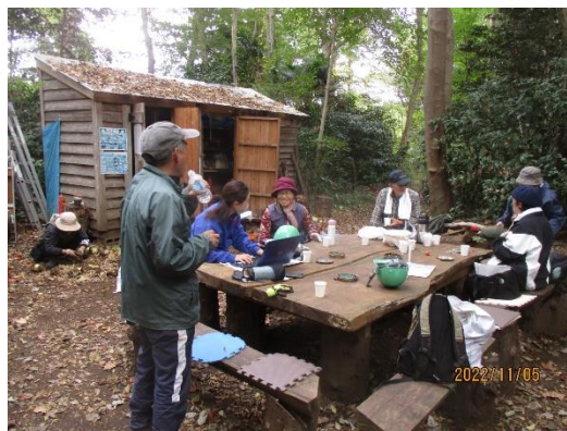
仕分けの一方で作業後の一息組も