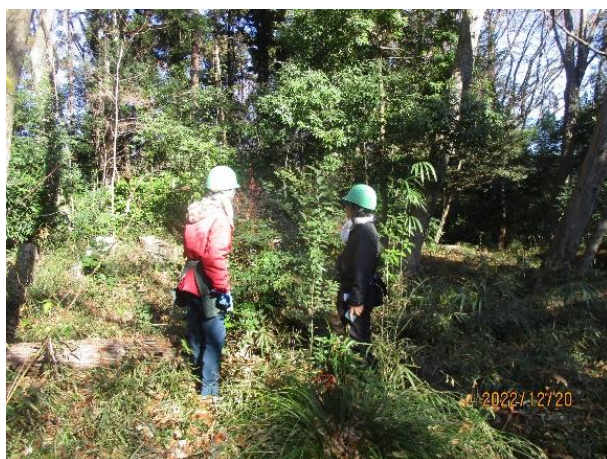
自然観察中の 2 人