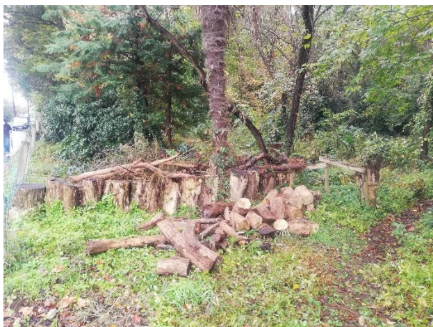
←薪材用として通用口に集積