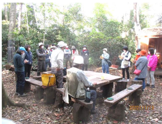
関係団体 朝の打合せ