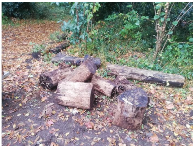
←北側広場入口縮小化用材にならないか