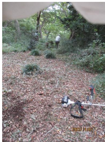
自然植生観察エリア現況