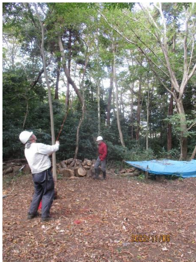
枯れ枝処理の状況