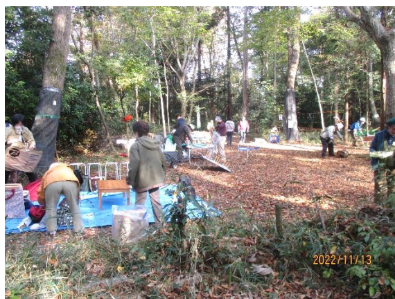
遊びの広場 事前準備の状況

午後以降の天候が危ぶまれたが、14 時 30 分終了予定まで降られず、スズメバチが現われず 強風は吹かず、ケガ・事故が無く終了。囲いやまと里やま応援団のブースは皆さんの協力のおかげで盛況でした。秋の「囲いやまの森」の風情を参加者一同が等しく満喫できるイベントになった。里やま応援団を含め松戸市の子育て関連 10 団体超の第 3 回目の協力イベントは成功裡に幕を閉じることができた。