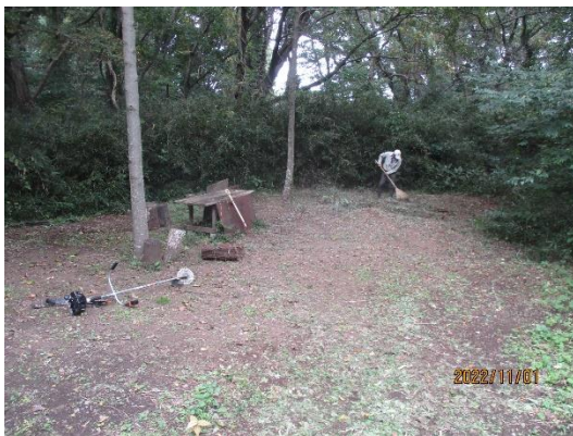
ケンポナシエリア現況