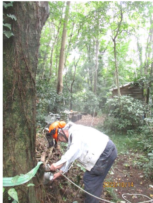
↑ ウィンチのセット