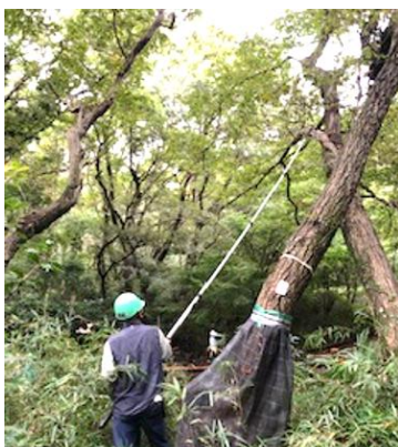
↑ ガラス類除去 ↑ シュンランエリア刈払試し