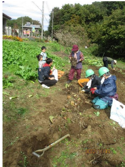
通りがかりの家族も参加