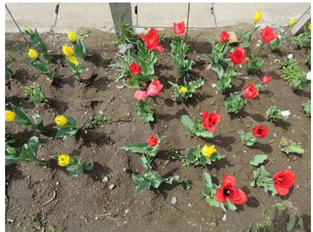
チューリップ各色