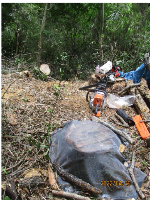
←切り株へのネット敷設（3/4 完了）