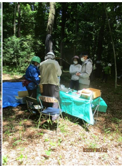
工作コーナーは客足絶えず 同伴の親父殿に発電機運搬の助勢依頼