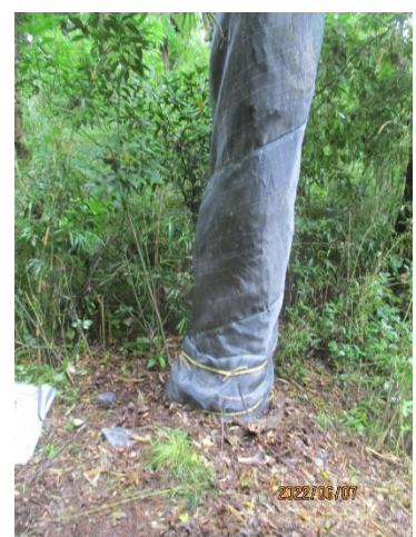
カシナガ脱出防止ネット