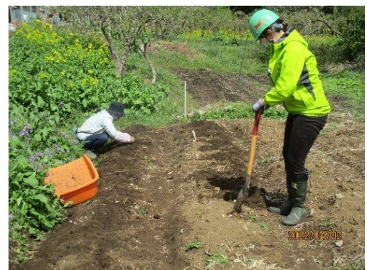
←花壇組↑サトイモ植付↓ガラス拾い