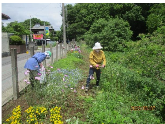
花壇周囲の雑草が消え花壇が際立つ