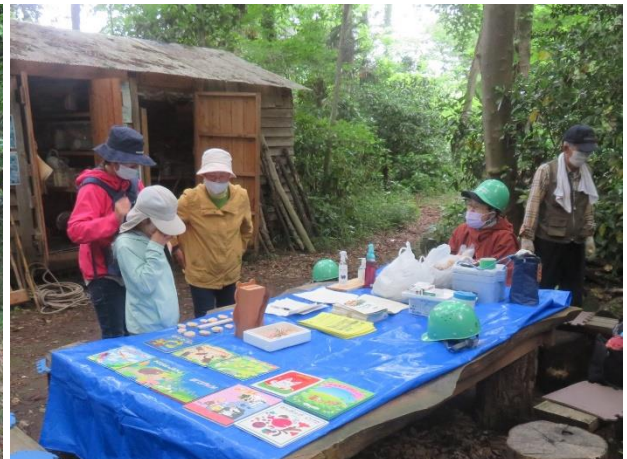
受付のテーブルに手作りのお土産と募金箱も