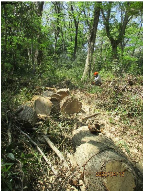
4 本目の玉切り 燃料切れで終了