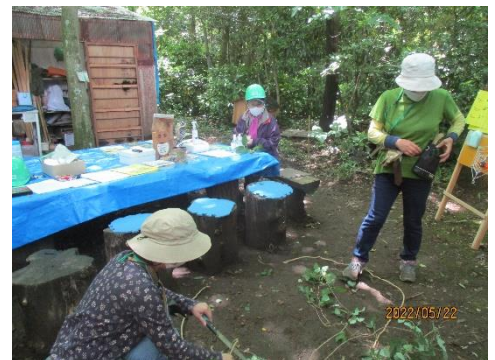
受付準備中の3人組の様子