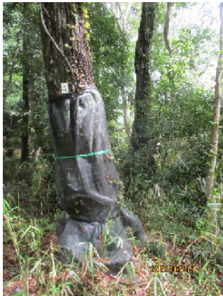
ネット巻き(穿入防止)