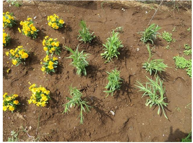
黄 パンジー・右 アグロステ