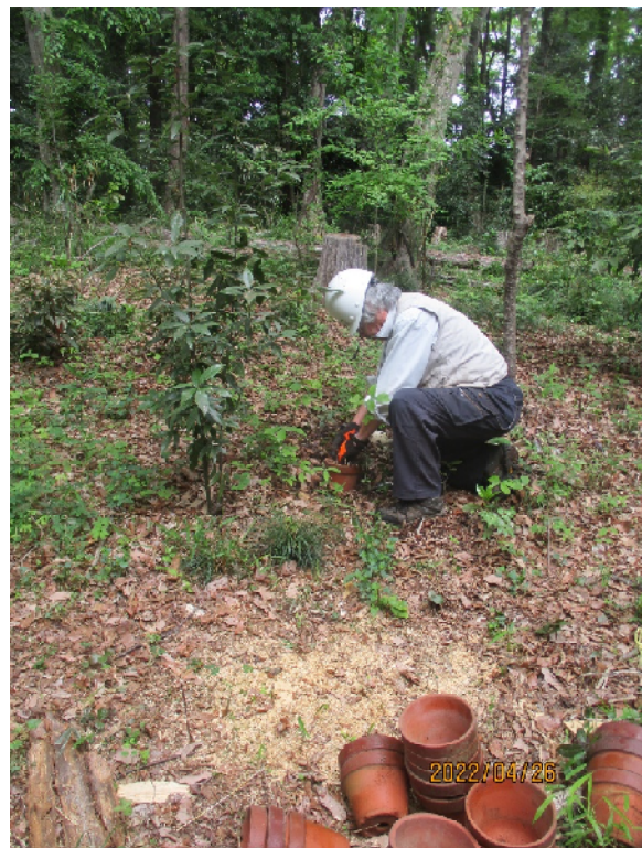
実生苗の鉢上げ状況