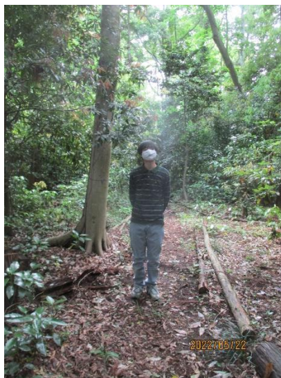
ゆったり自然観察の若人