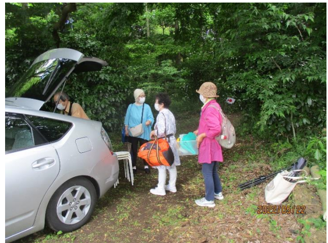
音楽隊の見送り(荷物運びも手伝う)