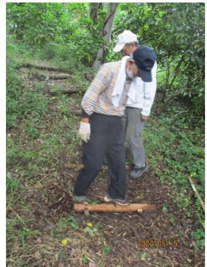
通路の手直し(裏方の支え)