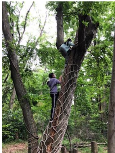
木登りネット, この子は勇敢