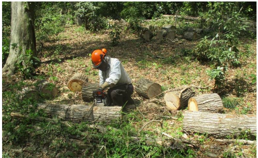
3 本目の玉切り こちらは完了