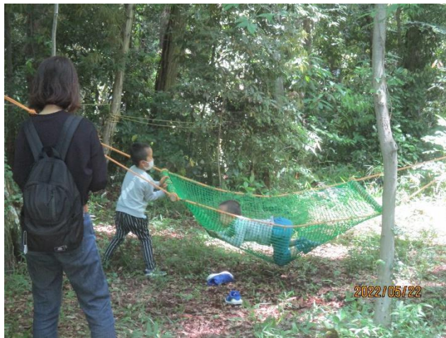
兄弟でハンモックごっこ