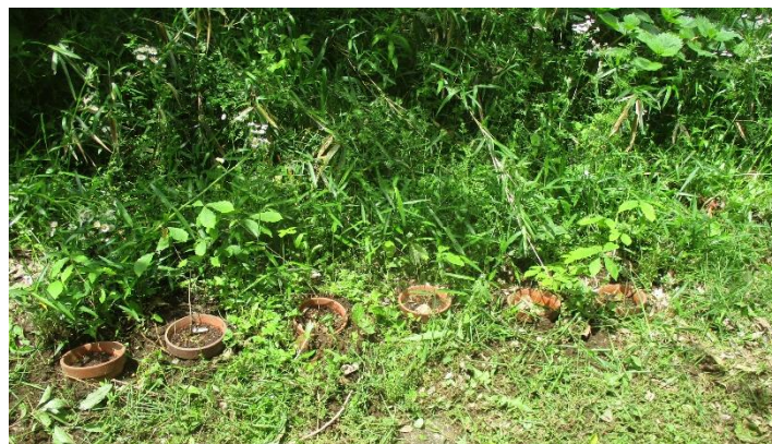
実生のコナラ苗木育成状況