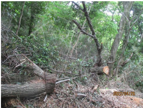
玉切り処理対象 結果は現場で確認乞う