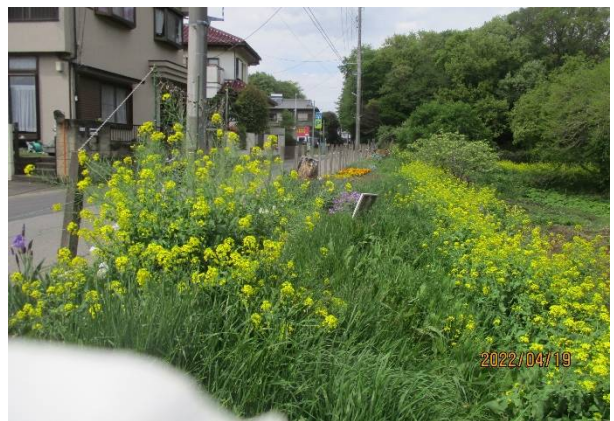
道路際の花壇(先が霞んで？見える)