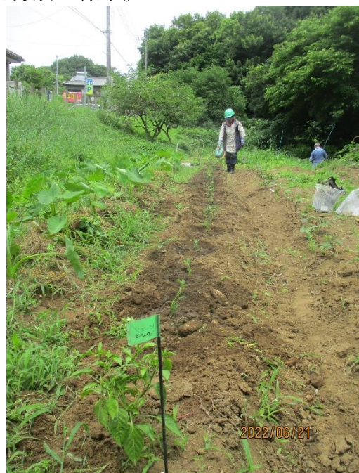
↑落花生苗はうまく 1 畝に収まる