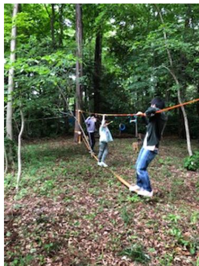
スラックラインは人気の的