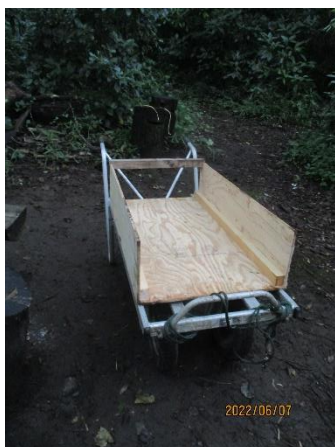
カートの落下防止枠