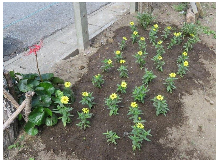
ジニア(百日草)2 ケース