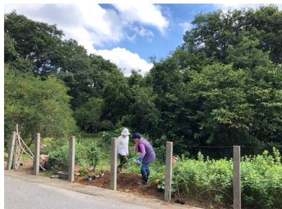
花壇作業の様子(学生助成前)