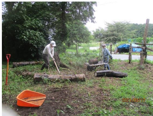
入口と北西広場周り作業状況