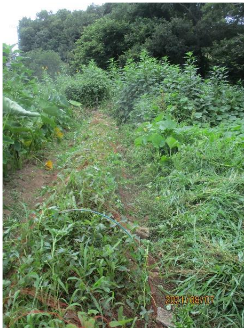
ピーナツの生育状況