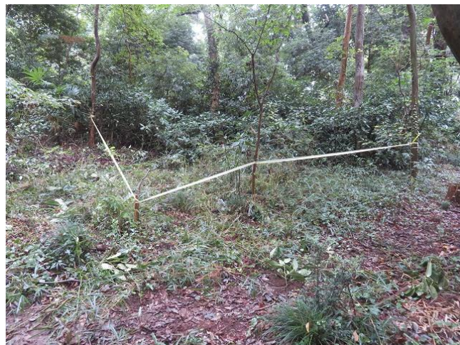
テープ張りで エリア確認(キンランの群生地)