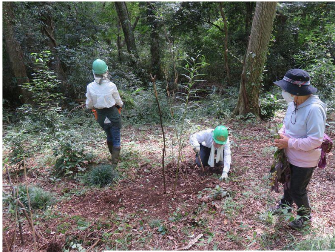
今年はヤマユリが7月に4本咲いた