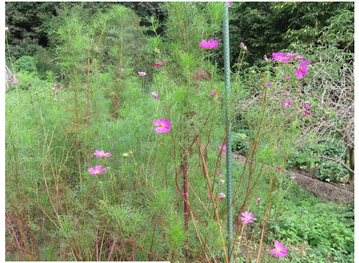
コスモスが見頃ですね