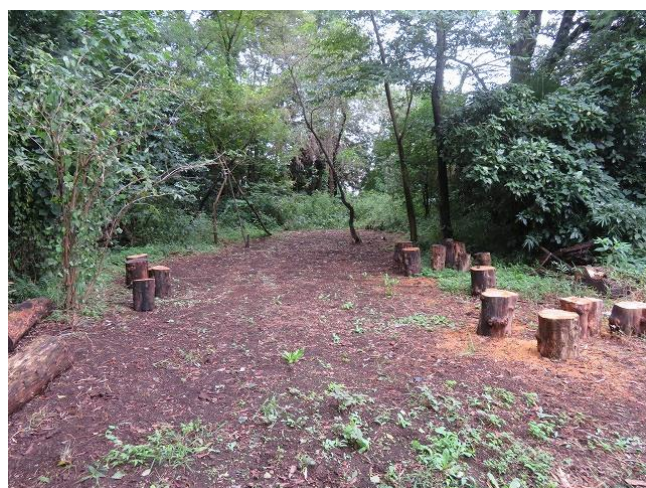
入口北西部も整備完了