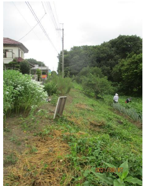
畑エリア道路側斜面刈払