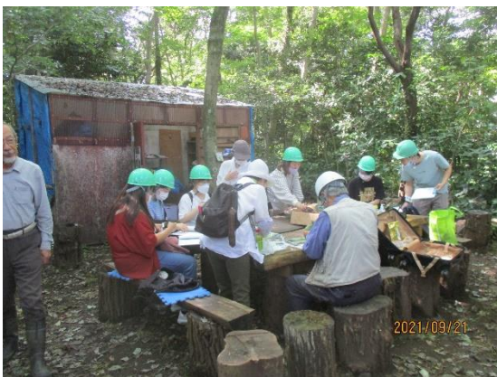
向さんの実験開始前の様子