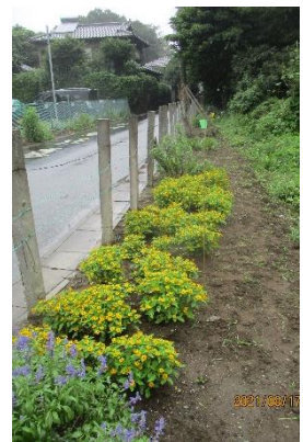
花壇除草後の様子