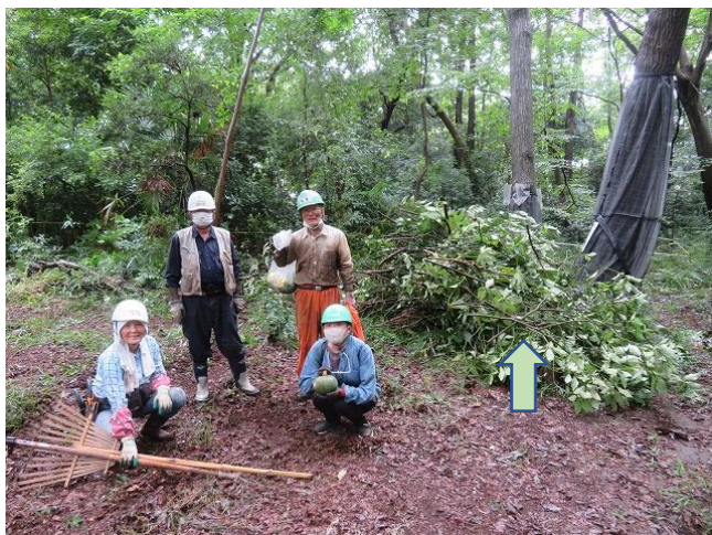
あそびの広場で整備状況を確認 ↑ アオキ伐採