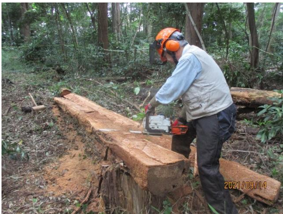
スギ材 2 分割