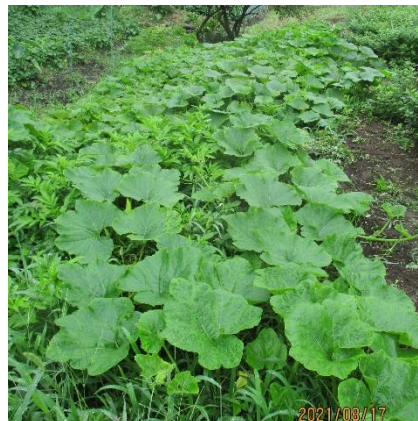
カボチャの弦の様 成果は疑問