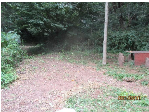
ケンポナシエリアからステージ方向の状況