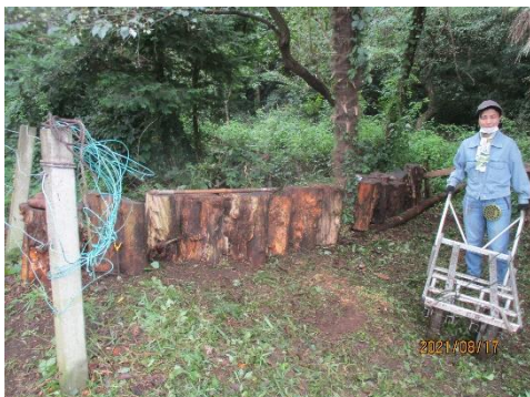
通用口整備状況と女戦士