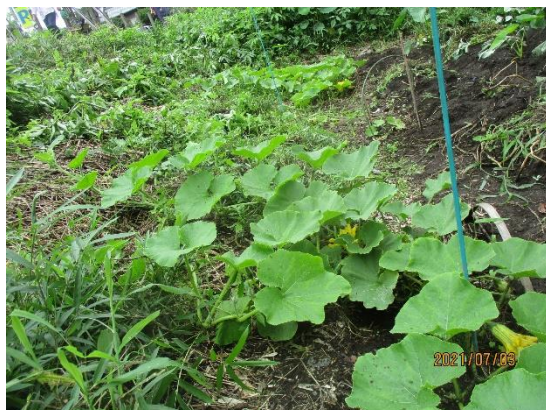
カボチャ生育状況