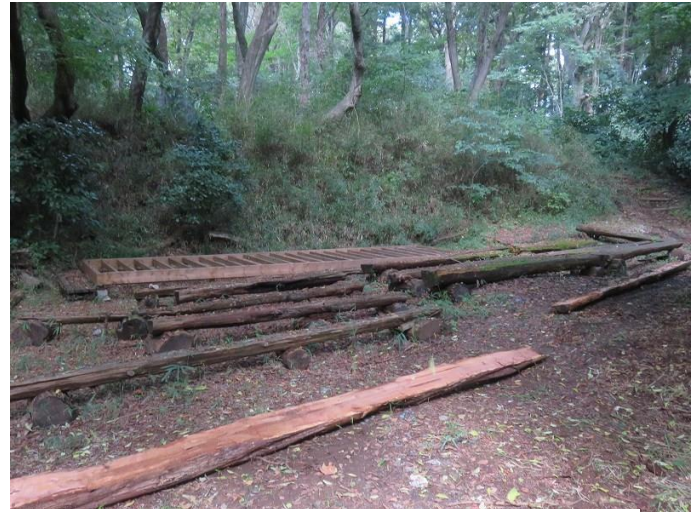
スギ材の「半割りをウインチでステージ迄運んだ