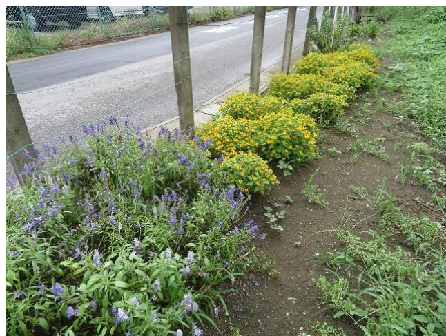
ブルーサルビア・メランポジウム