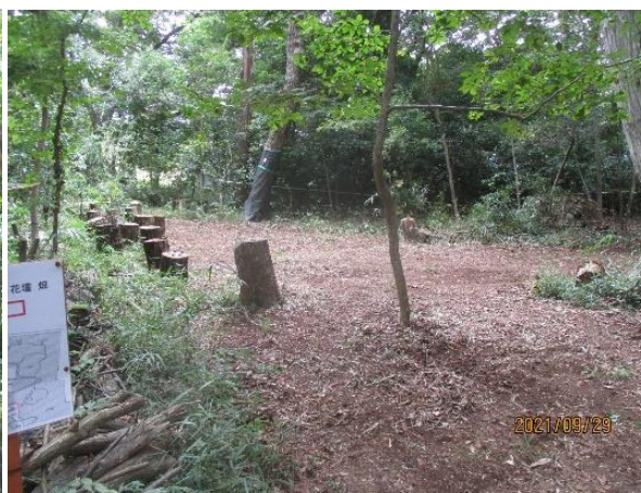
遊びの広場 拡張・整備の状況