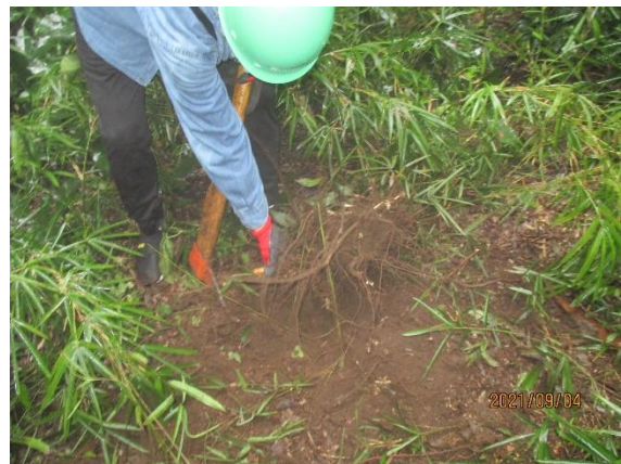
数回横根を切り、あと一歩