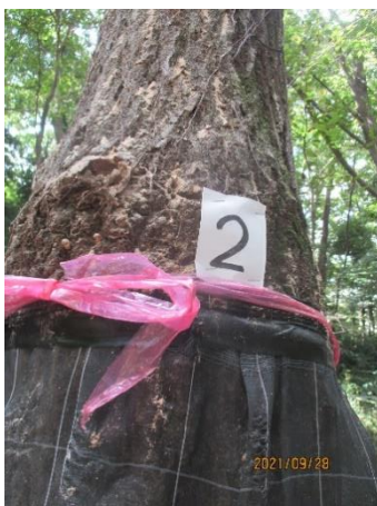
遊びの広場拡張の状況