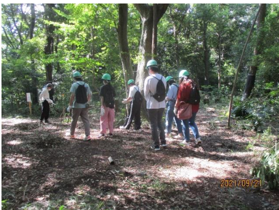
向さんによる森の案内(実験の一環)