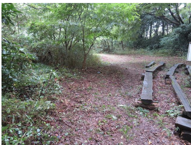
ステージ観客席後部を整備 (2列分の拡張)