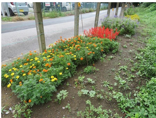
マリーゴールド・サルビア赤・ブルーサルビア