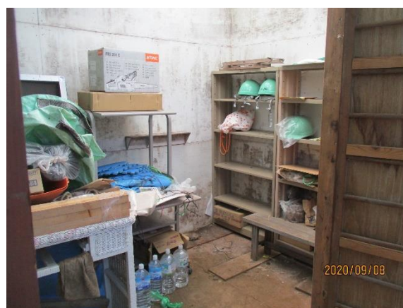
第 3 倉庫(仮名称)倉庫内整備(模様替え)