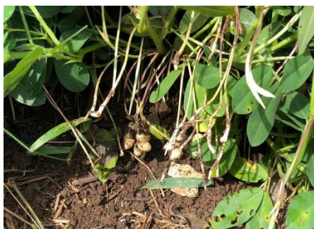
落花生の生育状況チェック