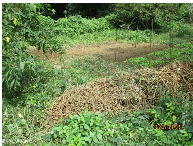
ソクズ園の変容(変化に期待)