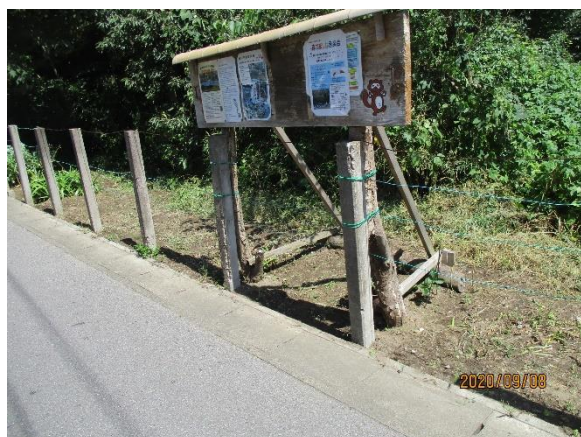
花壇全長に亘る刈払完