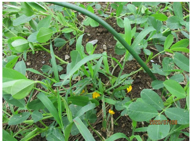
落花生の花が増えた