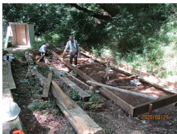
ステージ基礎部分の完成形