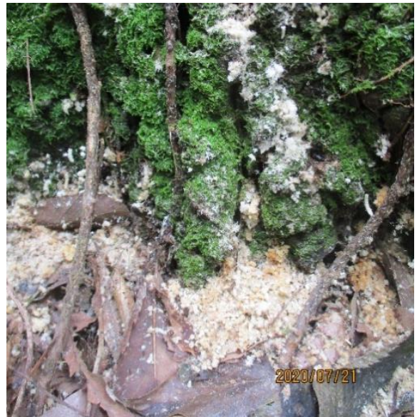
上：カシノナガキクイムシの被害