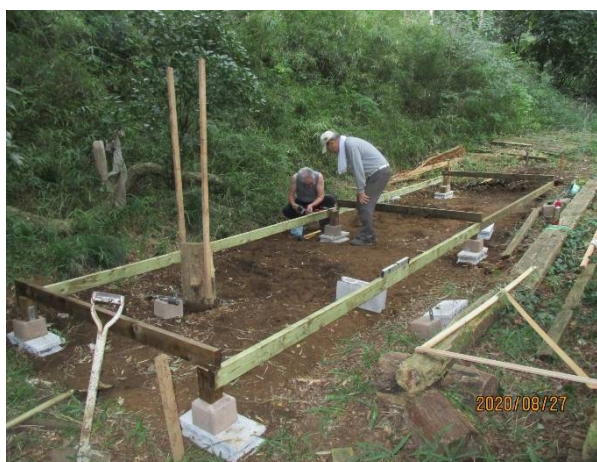
大引き設定中の調整