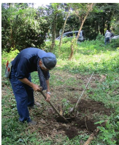
車で伐根 ソクズ牛蒡抜き→