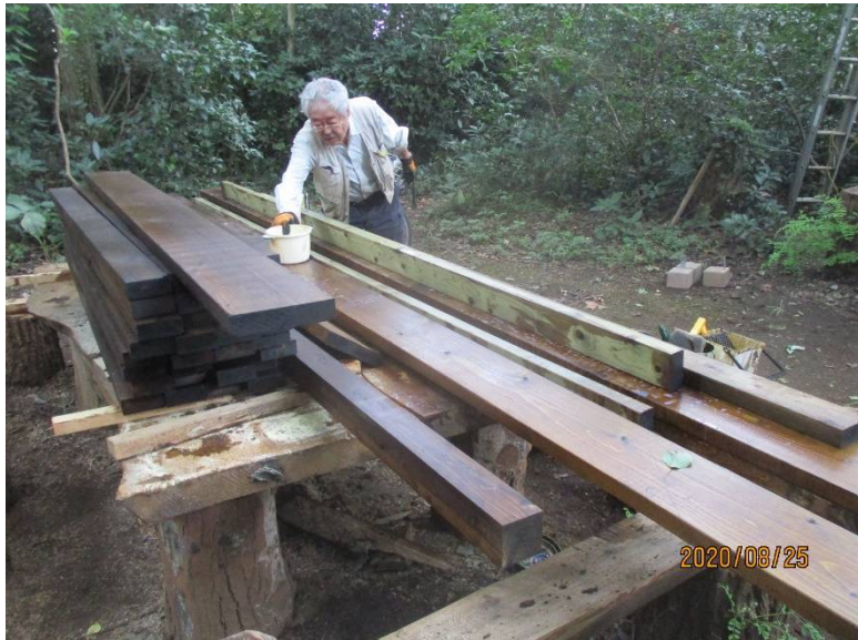
腐食防止処理材を購入したが防腐塗料を全用材に塗布