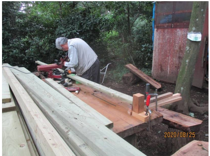
ステージ基礎の 2×4 の切断