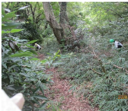
通路及び周辺も除草