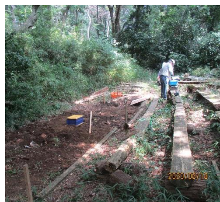
舞台改修 杭打ち完