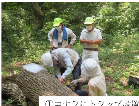
①コナラにトラップ設置 25s