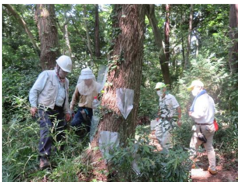
②コナラにトラップ設置 7s