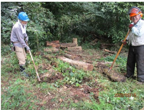
入口広場整備(車庫スペース拡大)