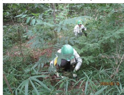
剪定鋏での笹刈 先は長そう