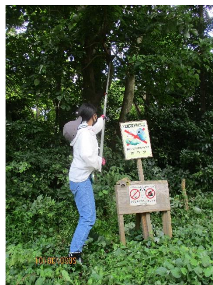
向さん高枝切りに挑戦 慢慢走