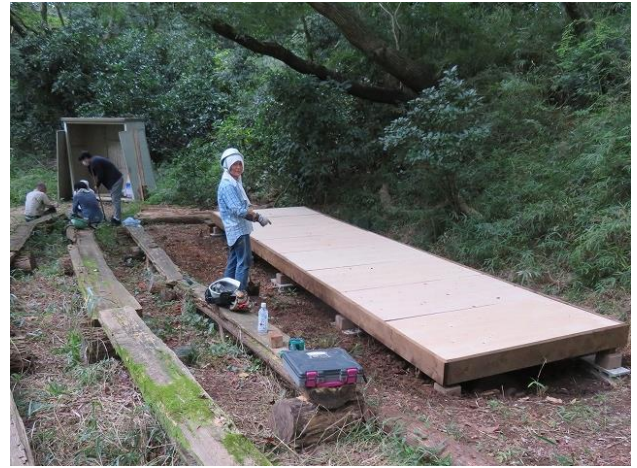
ステージ部材の調達:ジョイフル千葉 NT 1 日、基礎工事 3 日間、+ 根太の固定とコンパネ床の設置