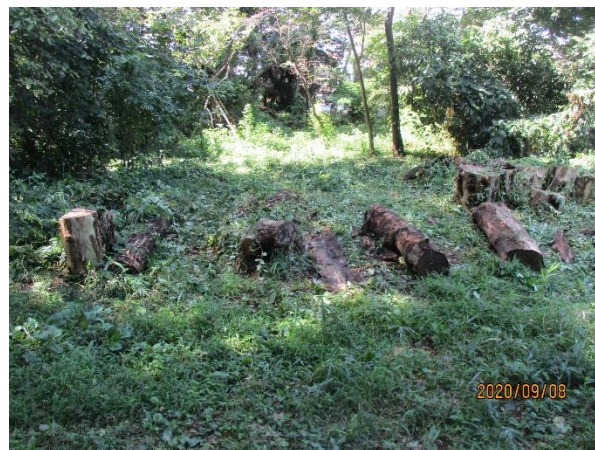
入口部刈払と切断木整理