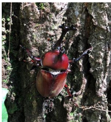
被害木上のカブトムシ