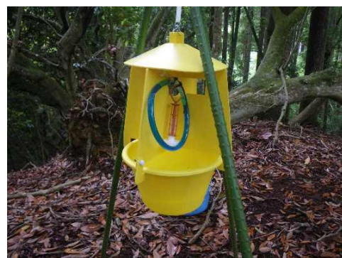
フェロモントラップ