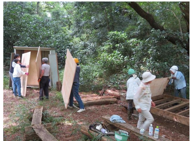
コンパネは倉庫に収納