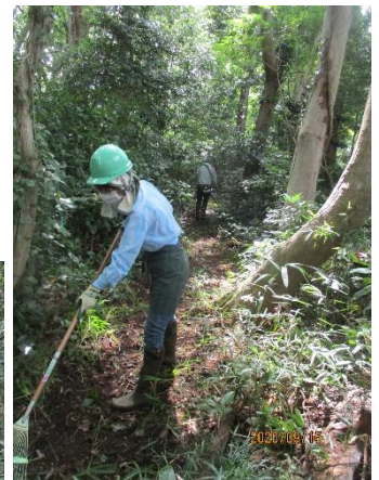
主要通路の面目回復