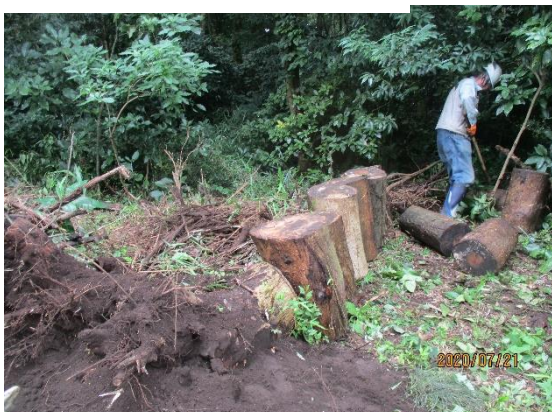
下：北西広場 倒木処理の様子