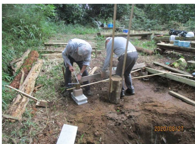
基礎部設定（束と大引きの釘打ち前の調整）