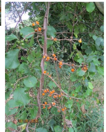
ツルウメモドキ結実