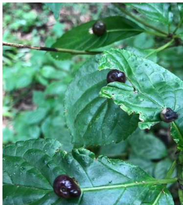
この時期のハナイカダ