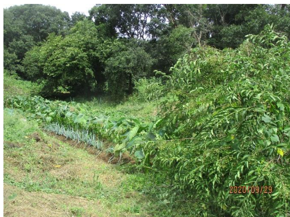
ネギとマユミの状況