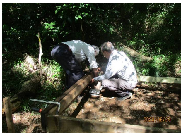
幕板取り付け中(クランプで固定し釘打)