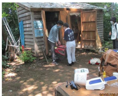
研究発表電源チェック OK