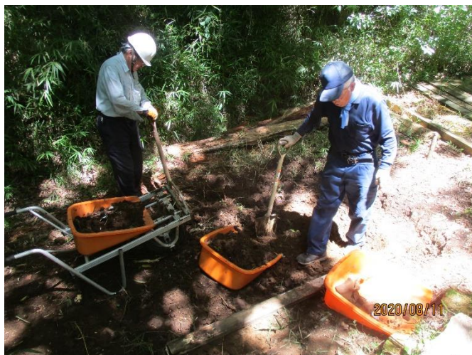
舞台エリア整地の状況西側の土を東側に運搬