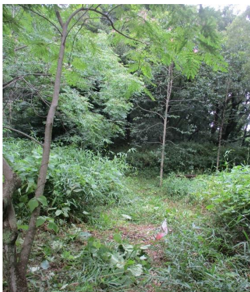
通路刈払後 左上のバックが梅檀