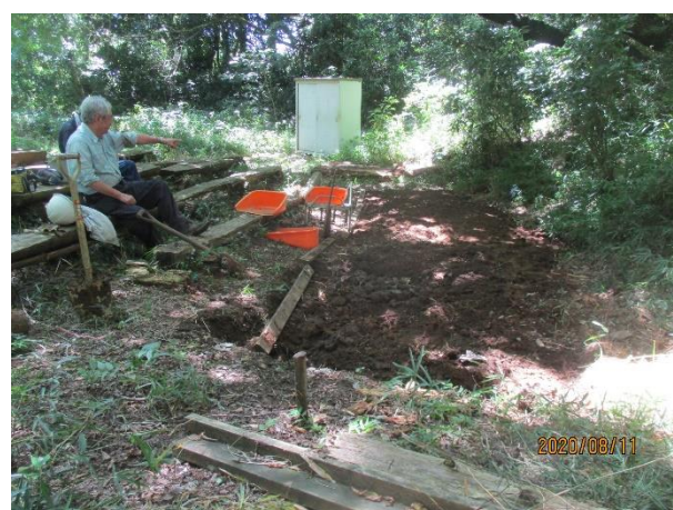
整地一步手前で出来栄え評価中