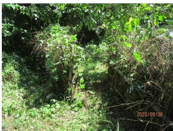
神社境界柵周辺刈払