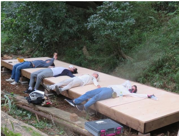
コンパネを敷き詰め完成:汗をかいて 喜び!