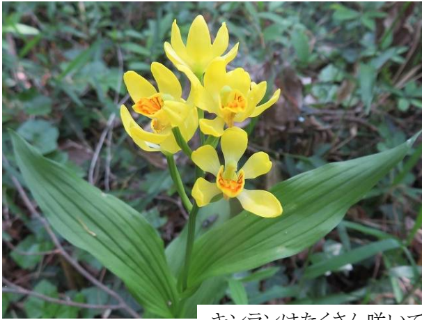
キンランはたくさん咲いて