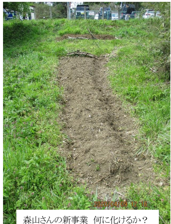
左 1 列ジャガイモ芽摘み完、右 2 列サトイモ植付完