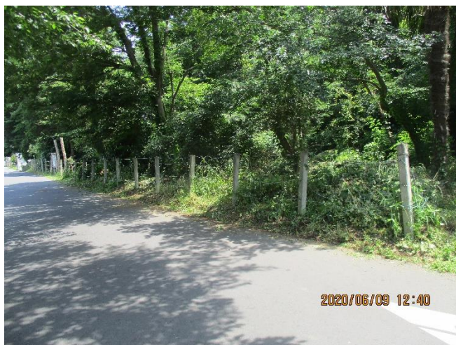
↑ 北縁西側 ↓ 北西広場整備の様子