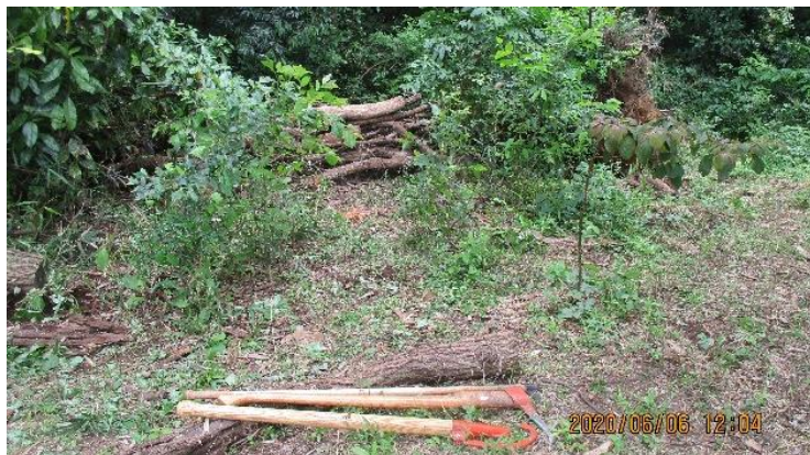
北西エリア だいぶ片づけ出来ました