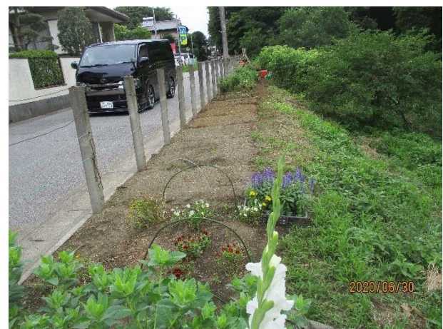
上 2 枚（入手苗と植付け用地の状況）