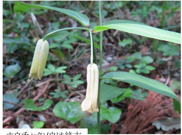
ホウチャクソウは終末