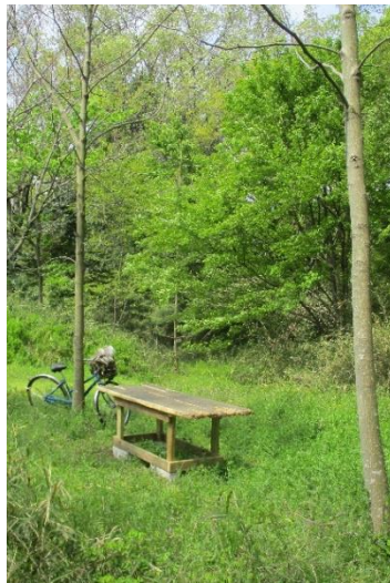
ケンポナシの間にベンチ