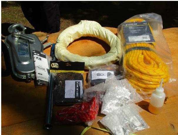
新規購入品(チルホール・ロープ等)