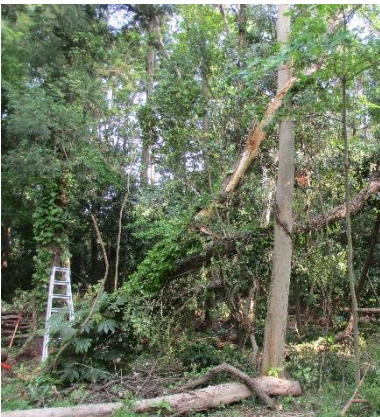
側面図(枝の股に架かる)