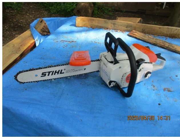
新規購入「スチールのチェーンソー」