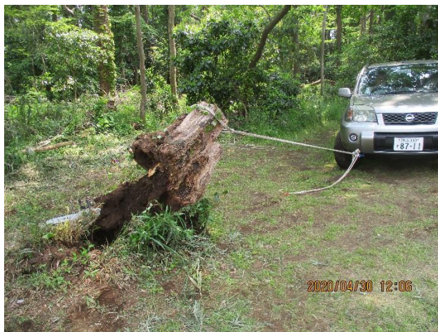
正門広場のハリエンジュ切株除去の様子