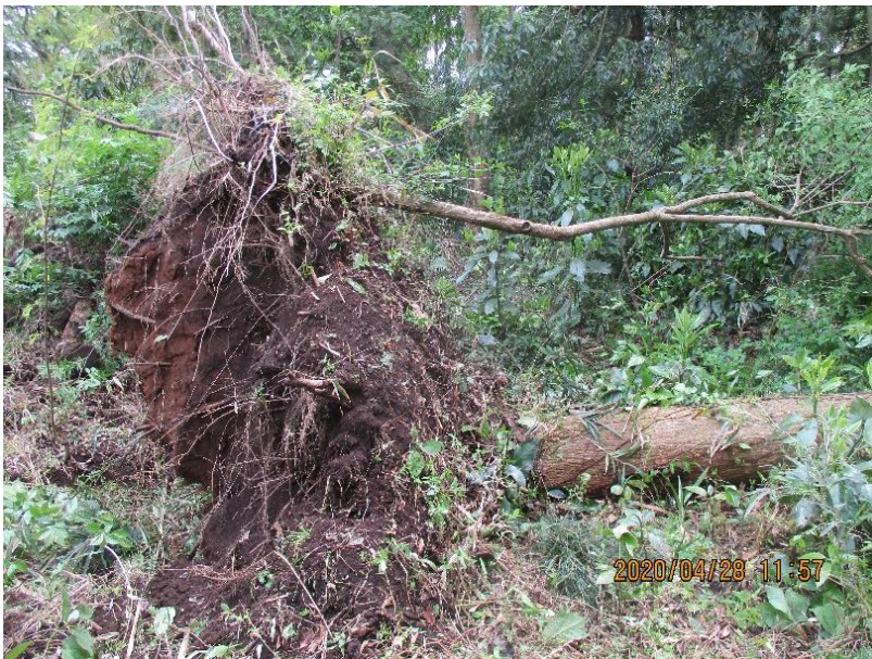
倒れ方も見事だが上部の生木もけなげ