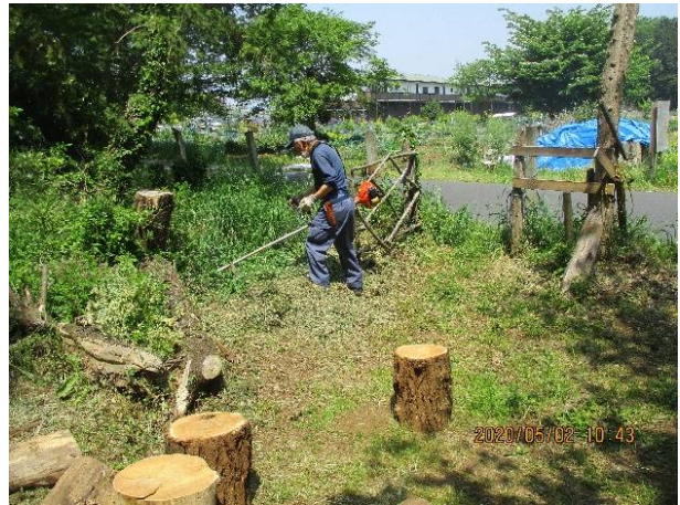
入口付近の腰掛用丸太と刈払機で除草