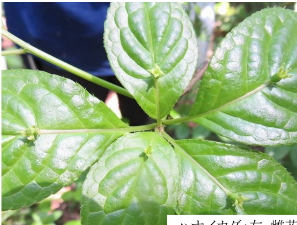
ハナイカダ:左 雌花