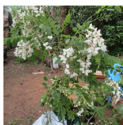
ハリエンジュの花