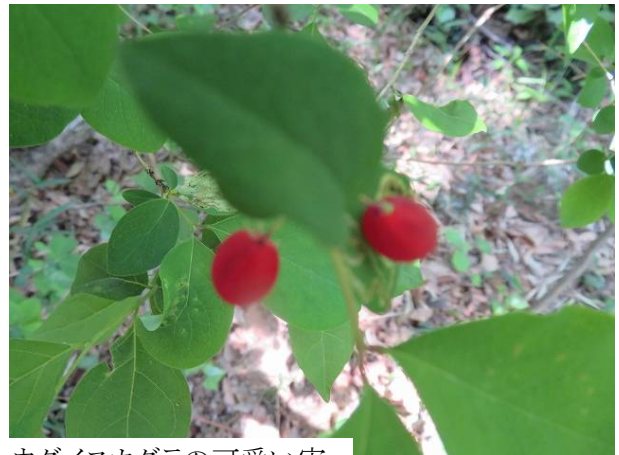
ウグイスカグラの可愛い実