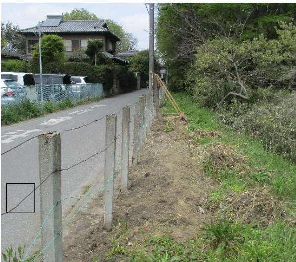
西側掲示板周囲の花壇造成の様子