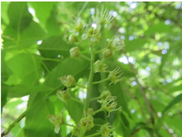
イヌザクラは終末 ウワミズザクラも面影ナシ