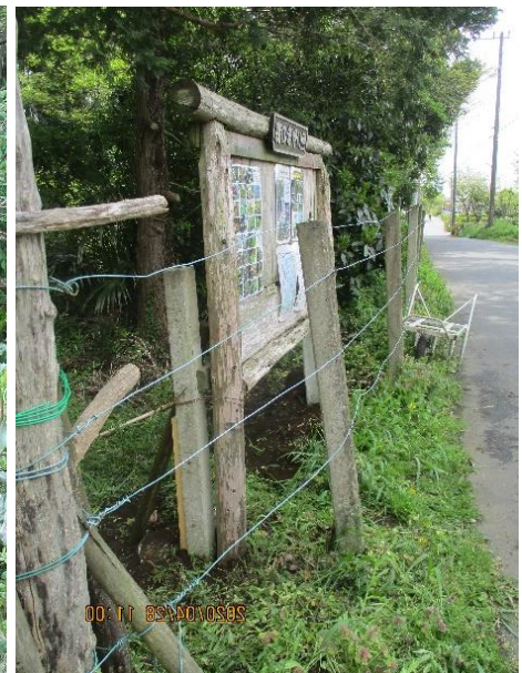
掲示板、杭の傾き是正後