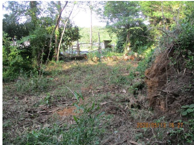
倒木引出し後の様子