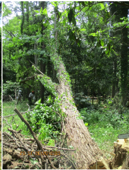
右手の幹(枝?)が架かり木に