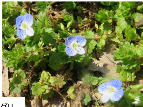
ヒメオドリコソウ カキドウシ オオイヌノフグリ