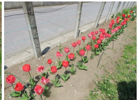
0404 見事に咲くチューリップ