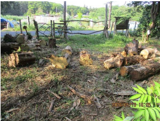
切断し引出した倒木の山