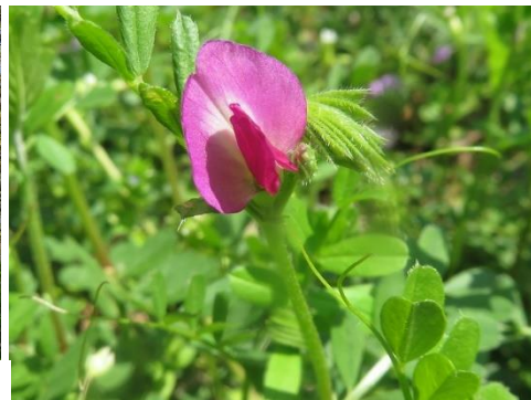
ニワトコ コブシ カラスノエンドウ