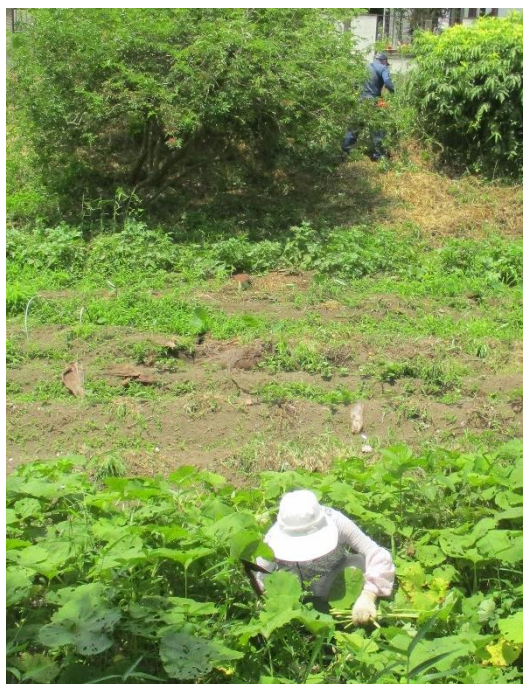
↑ フキ収穫と刈払 ↓ 薪材料搬出の様子