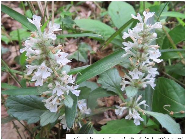
ジュウニヒエもたくさん咲いて