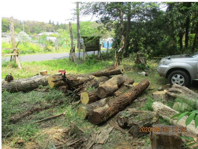
車で滑車を利用して引出したハリエンジュ伐倒木