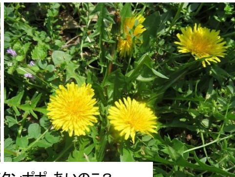
タチツボスミレ タチツボスミレ色違い(濃さ) 関東タンポポ あいのこ?