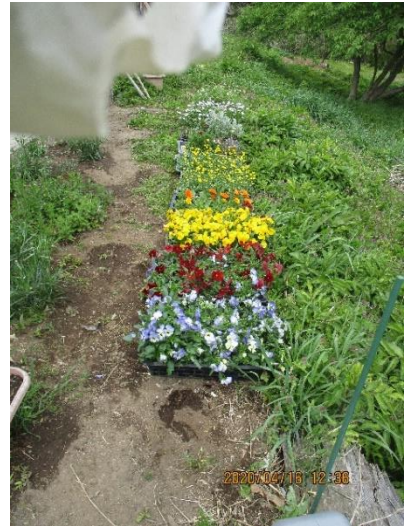
パンジー・ムルチコーレなど