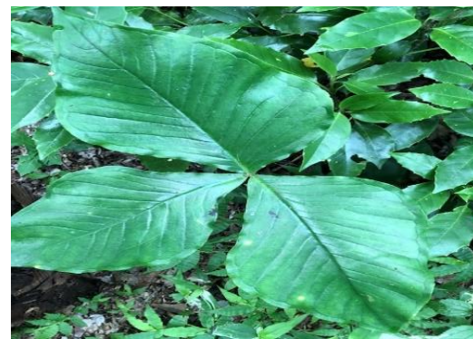
ムサシアブミ生育確認