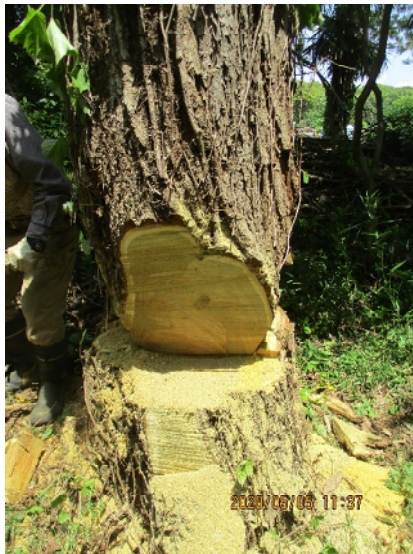
直径大対策(受け口両側切断)