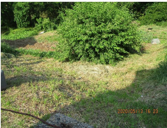
畑周囲刈払後の様子