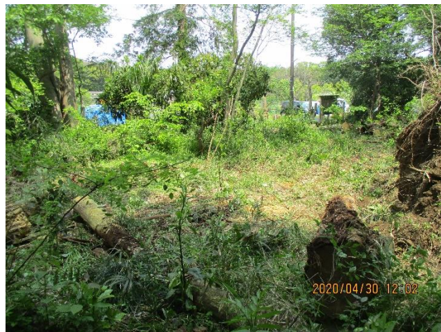
倒木等が大分除去され広場出現の様子