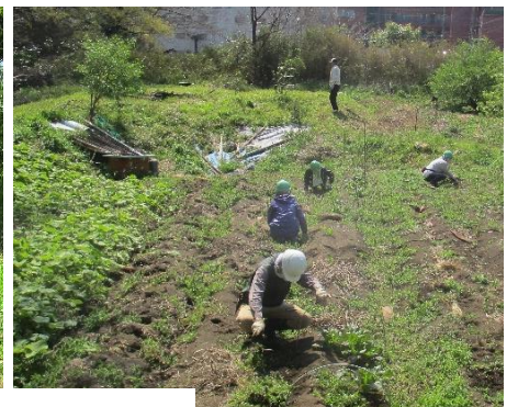
西掲示板供用開始 ステージ改修議論 青空の下 除草作業に勤しむ