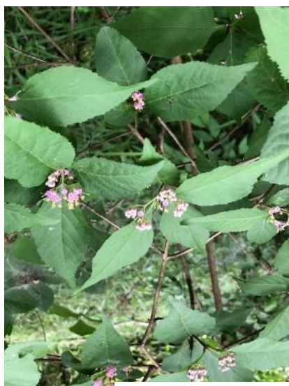
ムラサキシキブ開花