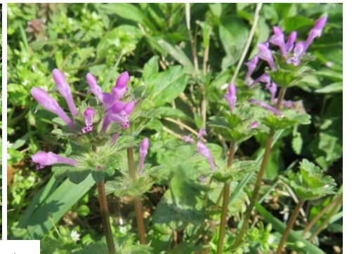
ショカツサイ ムラサキケマン ホトケノザ