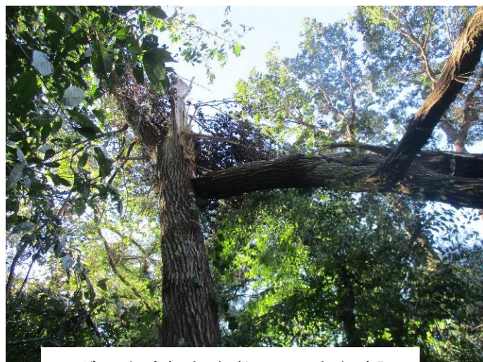
スギの中途折れ多数 6～7本を確認