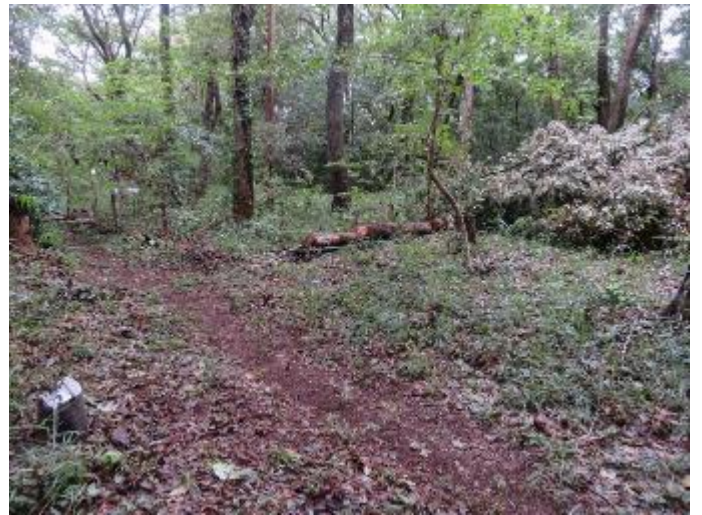
広場 通路の整備を実施