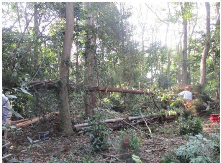
左側が地上から跳ね上がり傍の作業者が幹の動きで跳ね上げられた。