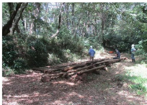
ステージ周辺 上空もすっきり