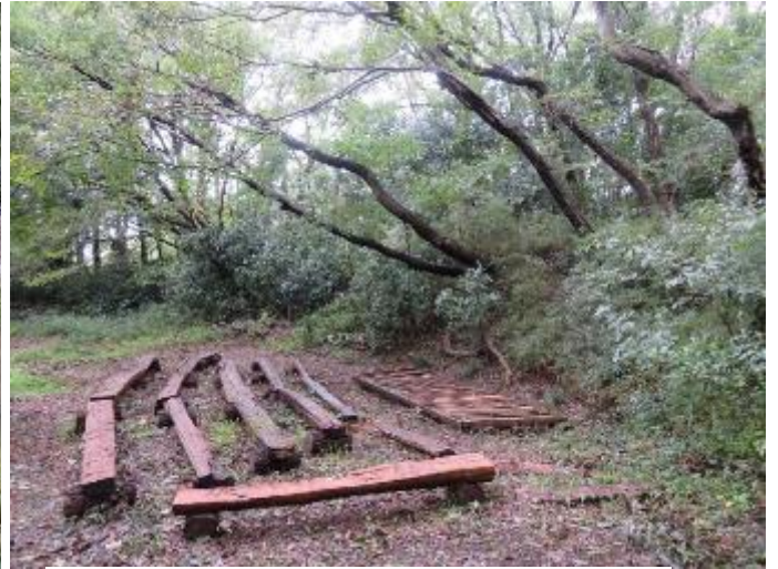
ステージ周りは枝の落下が多く 整備後