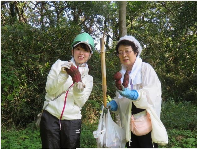
ケンポナシの広場でパチリ