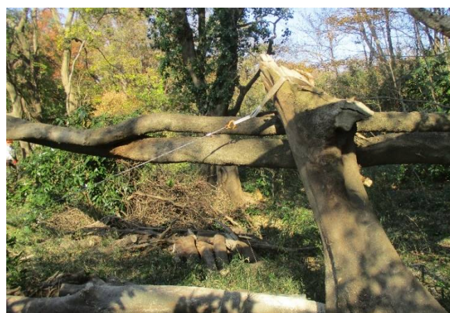
架かり枝の先端を切り詰め引き倒すところ