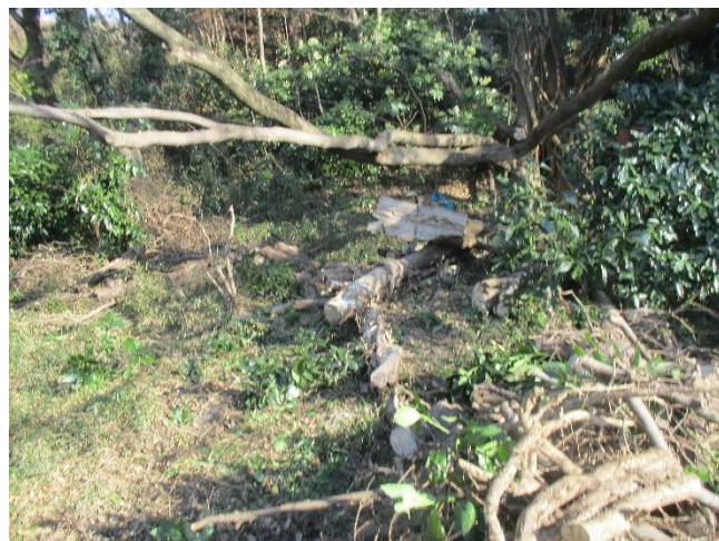
架かり解消、片付け完