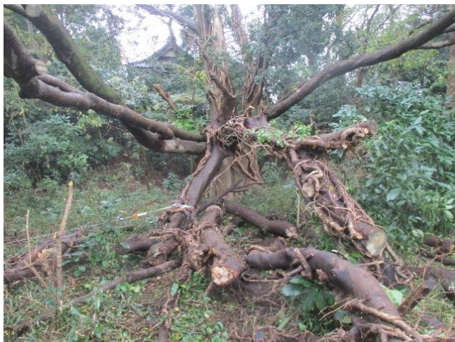
作業前の様子（高枝切で下した枝が散在）