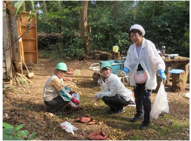
みんなで分けました