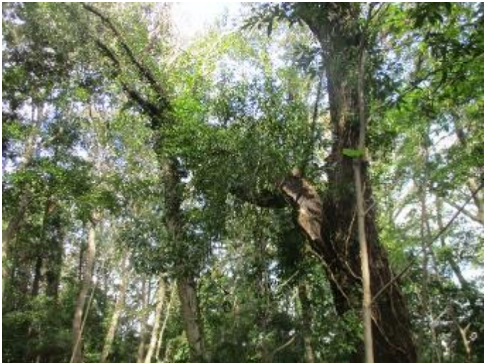
折枝の上部をロープで引く(1.5t) が変化なし 中断