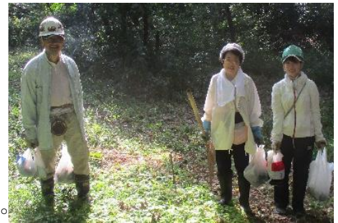
収穫後ご満悦の皆さん