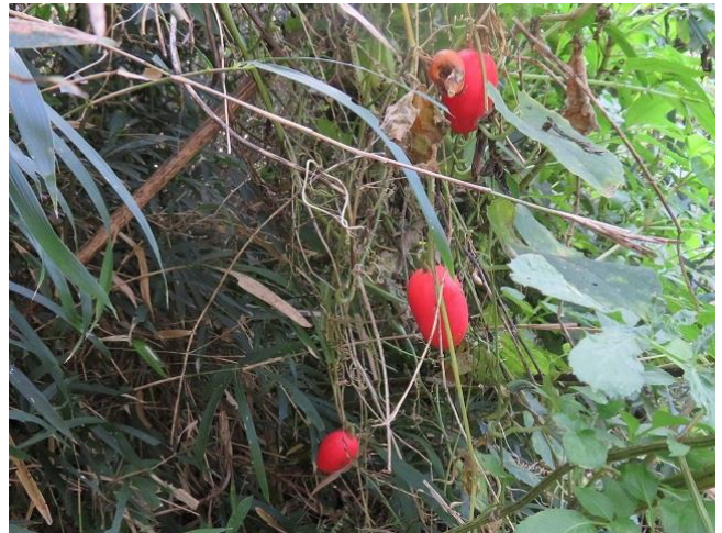
真っ赤に熟したカラスウリが輝いていた