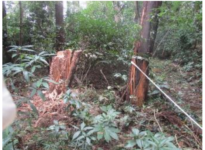
切り株上での回転に期待したが、 3度程ロープ盛替えなどして処理 所要時間2時間強