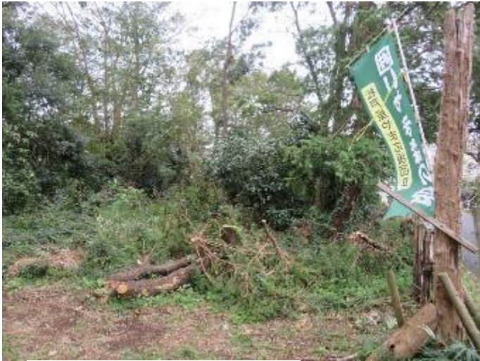
囲いやま入口 右側が台風の