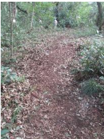
通路の状況→箒目あり