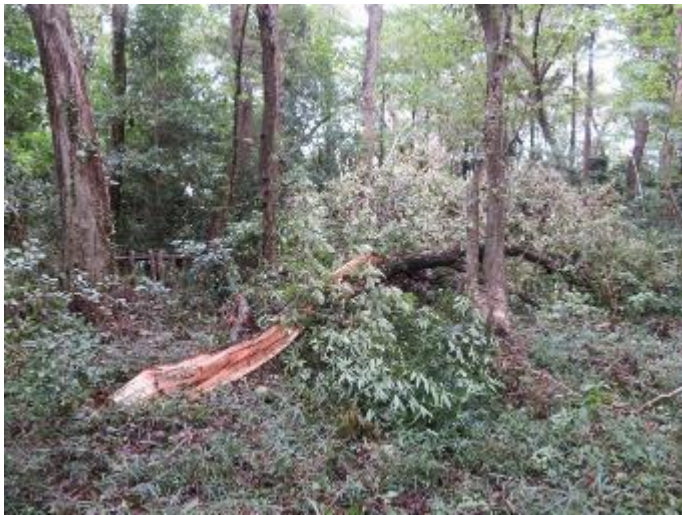
植生保護エリアの大木枝が裂け…