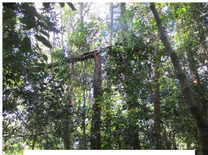
神社脇 エノキの中途折れ(途中で裂け