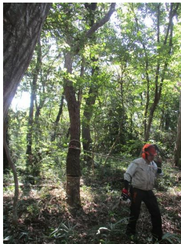
コナラ伐倒 架かり木に