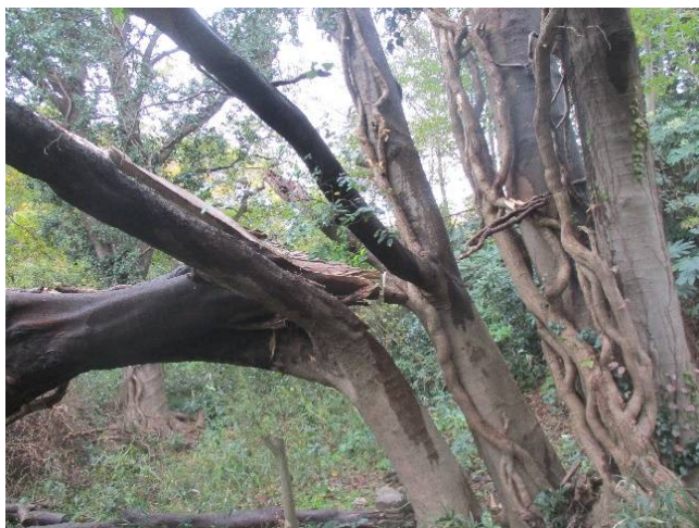
架かりの状況(作業前)