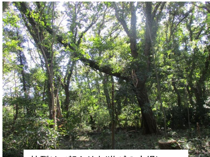
枝裂けで架かり木(遊びの広場)