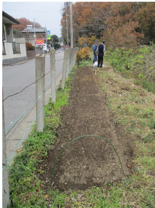
チューリップ花壇 (6日植付完 by 福元&森岡)