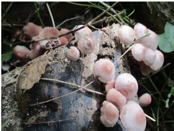
キノコ：チシオタケ