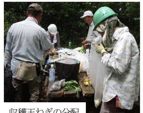
収穫玉ねぎの分配