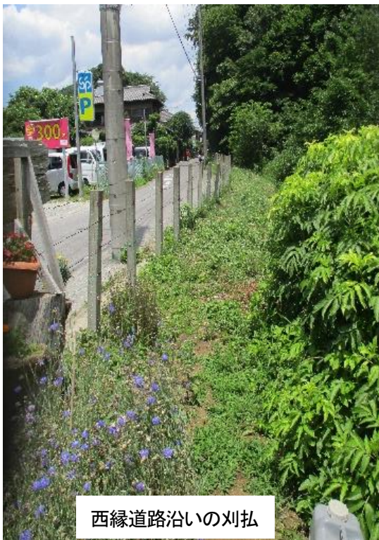
西縁道路沿いの刈払