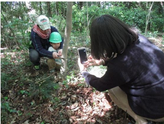
木こり体験(親子総出の奮闘、森が明るくなりました)