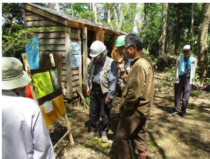
OF アンケート用紙板と募金箱談議