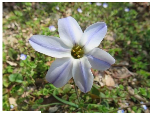
タンポポ オオイヌノフグリ アマナではなさそう: ハナニラ