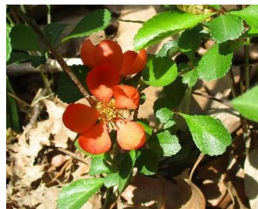
クサボケ(南広場方面)