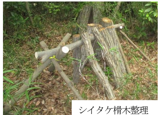
シイタケ櫓木整理