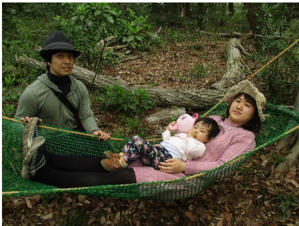
絵になるのはやはりこれかなあ