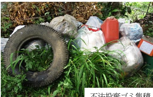
不法投棄ゴミ集積