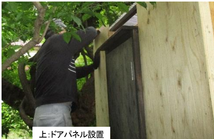
上:ドアパネル設置