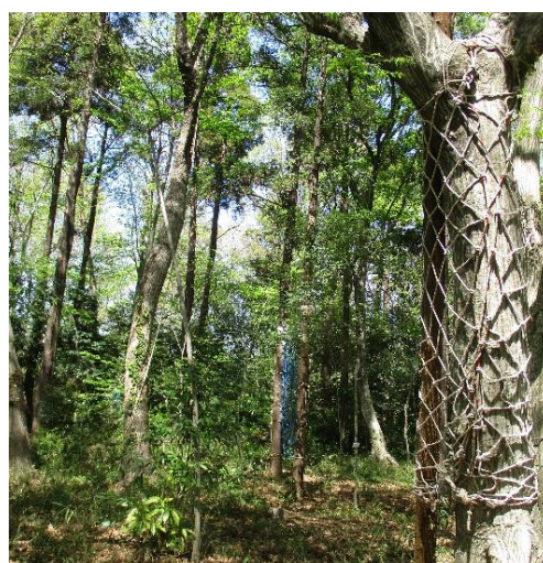
木登りネットと垂直ネット