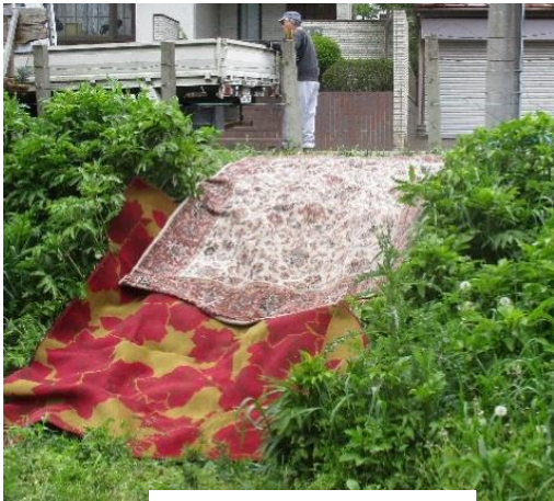
パネル搬入ルート確保