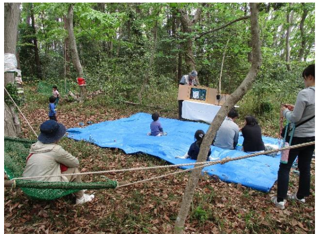
囲いやまの名物「紙芝居」だが大入りとはいかず