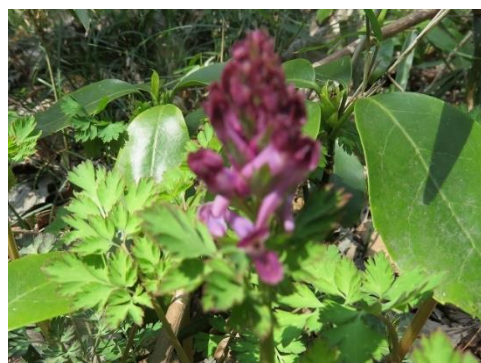
ショカツサイ タチツボスミレ ムラサキケマン