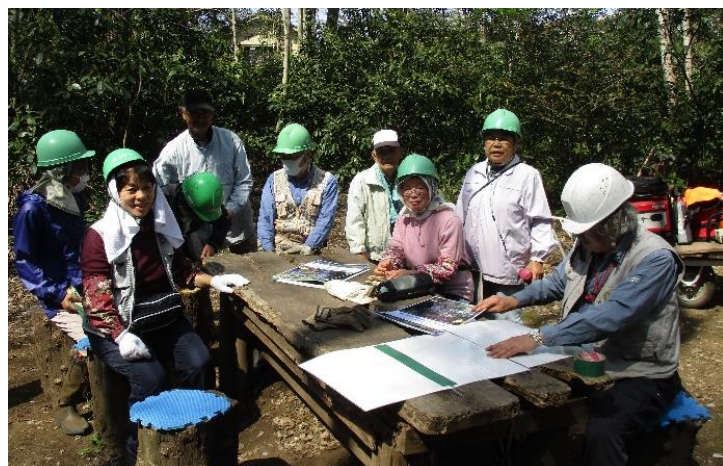
新年度の集合写真