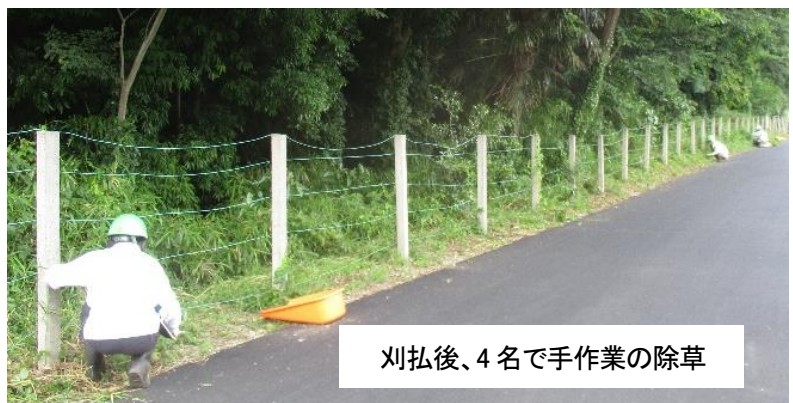
刈払後、4名で手作業の除草