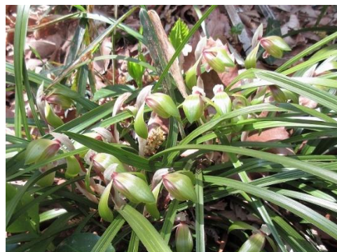
マルバスマシレ クサボケ シュンラン