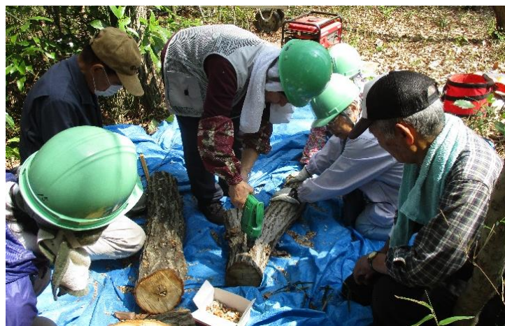
シイタケ植菌 心を合わせ、心を込めて