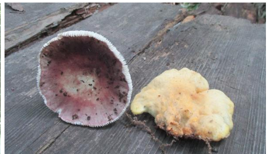
カワリハツ(ベニタケの仲間)、右:ヒラフスベ