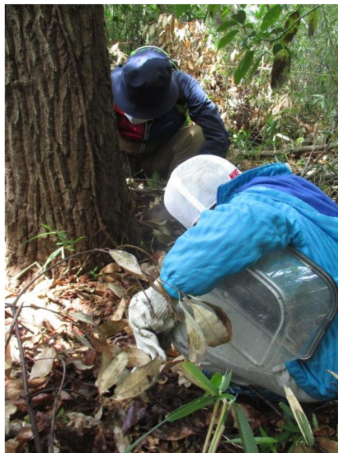
カブトの幼虫探し(準備ヨシだが)