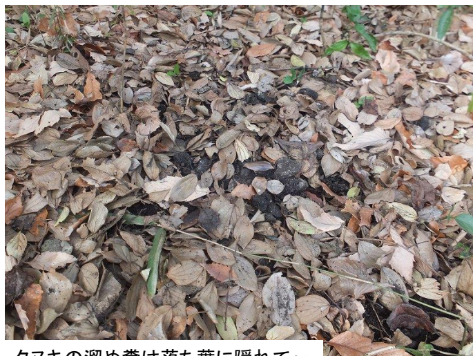
タヌキの溜め糞は落ち葉に隠れて～