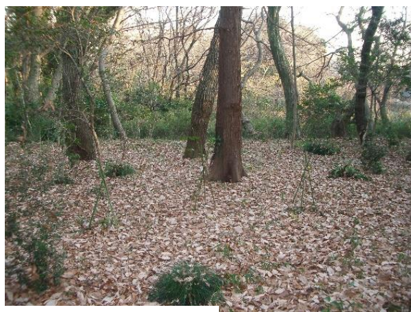
西縁伐倒・枝落としの前後 野草観察エリアの草刈後