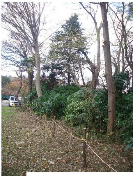
西縁北側枝払い・ロープ張り