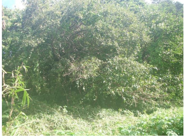
南西草地マユミの木周りでのゴミ拾い 南西エリア クワノキのツル類伐り払い