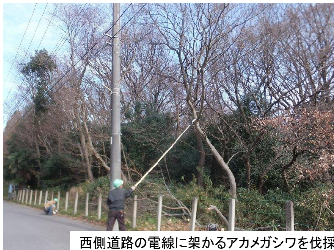
西側道路の電線に架かるアカメガシワを伐採