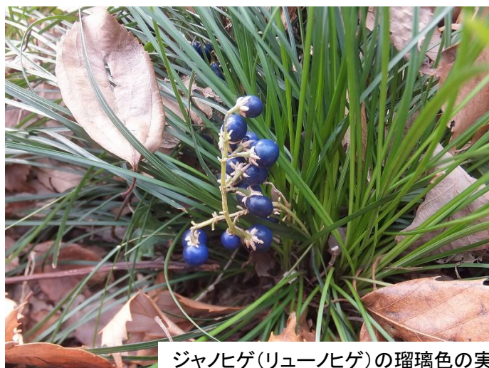
ジャノヒゲ(リュウノヒゲ)の瑠璃色の実