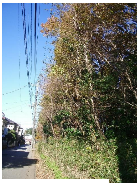
北側境界付近の樹々の様子