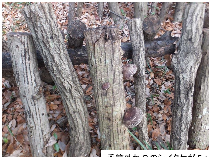
季節外れ?のシイタケが5ヶ