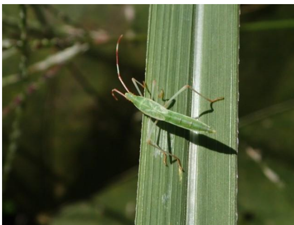
触角が紅白柄のヘリカメムシ