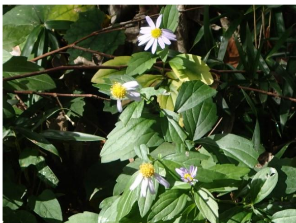
西側道路沿いのカントウヨメナ

観察記録 作業一辺倒でしたので点数は少ないですが、下の写真のような囲いやまでは珍しいのを見つけました。