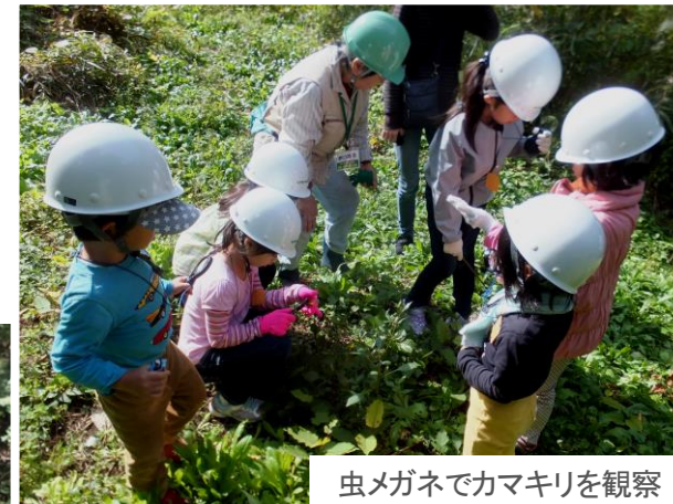
虫メガネでカマキリを観察

子どもっとまつど「子ども自然体験」 2016年10月23日（日） 子ども11名・大人名・スタッフ4名 囲いやま森の8名 お天気が良くて 楽しい一日でした