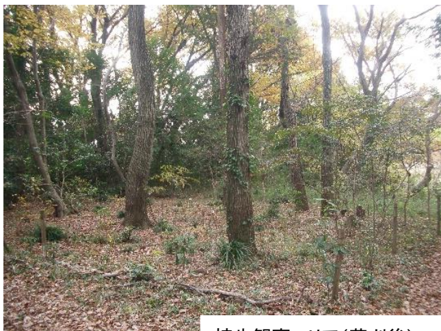
植生観察エリア(草刈後)