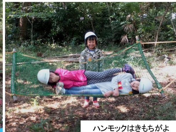
ハンモックはきもちがよ