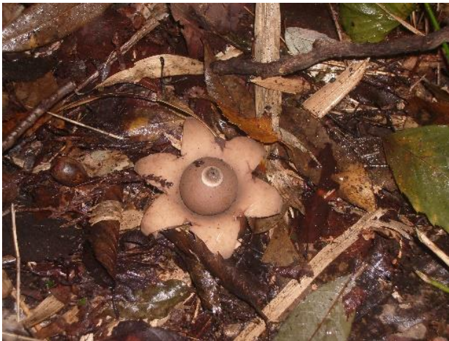
中央広場隣接地で見つけたキノコ

少し気持ちにゆとりが出たところで、中央広場隣接地の位置づけを出席者で議論。新開設の通路は常時は閉鎖。必要時のみ使用とした。