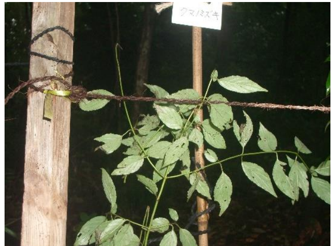
同エリアに見られるクマノミズキ

10 月 2 日（日）は「森で楽しむ音楽会」、久しぶりの太陽がまぶしい好天に恵まれた。ステージのコンパネ敷設は、おかげで汗だくの作業になった。土台の追加で根太相互の水平度が狂いその補修等への対処も含め、客席のシート掛け・園内通路表示・お茶出し等諸準備を午前中に終了した。