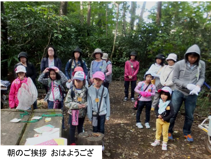
朝のご挨拶 おはようござ