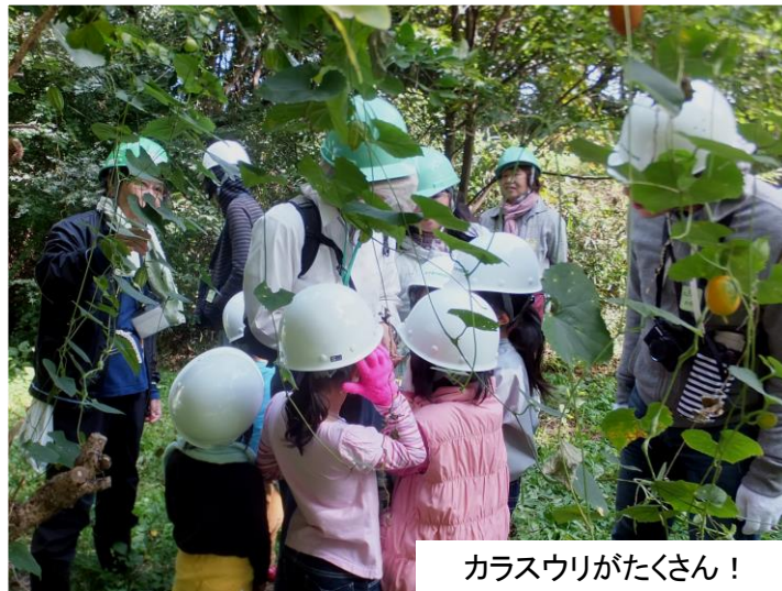
カラスウリがたくさん！