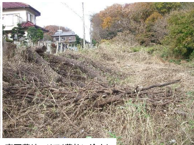
南西草地エリア(草払い途上)