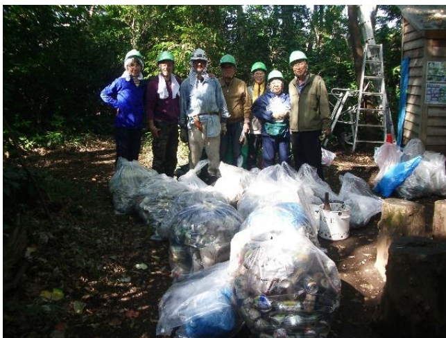
倉庫前の広場を占領したゴミと収集分別部隊