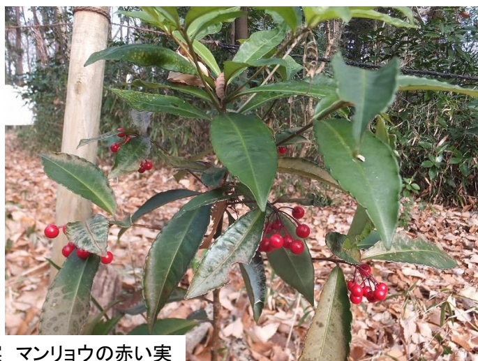
マンリョウの赤い実