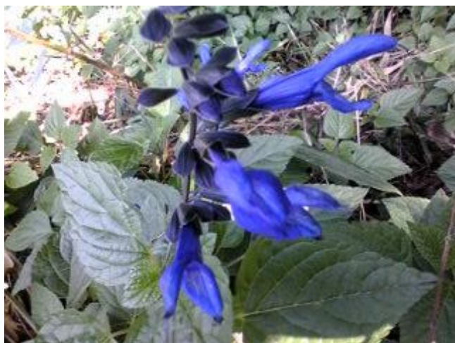
西側道路沿いにブルーセイジが綺麗に咲いていた