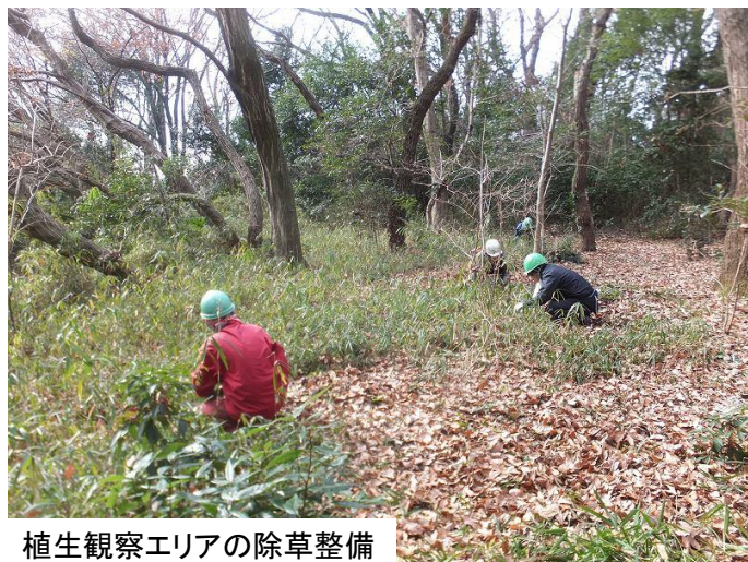
植生観察エリアの除草整備