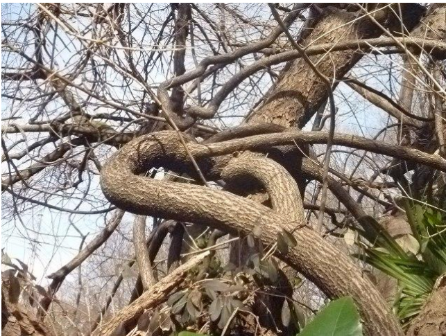
巨大なツルウメドキ