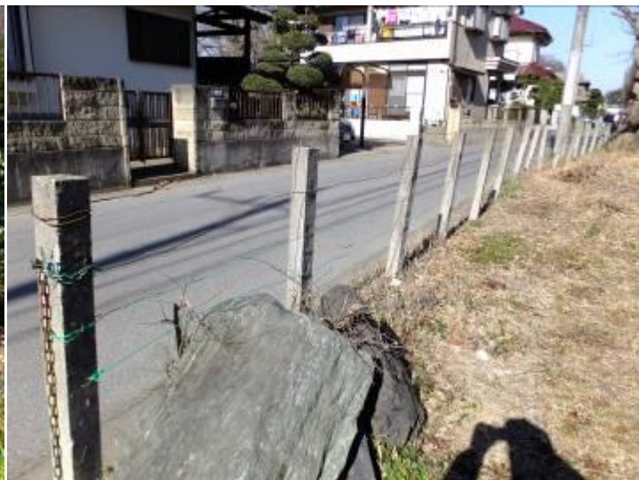
西側道路の公開柵の番線張り替え