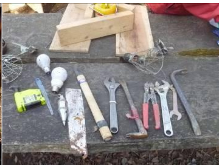
西側道路沿いの不法投棄ゴミを収集