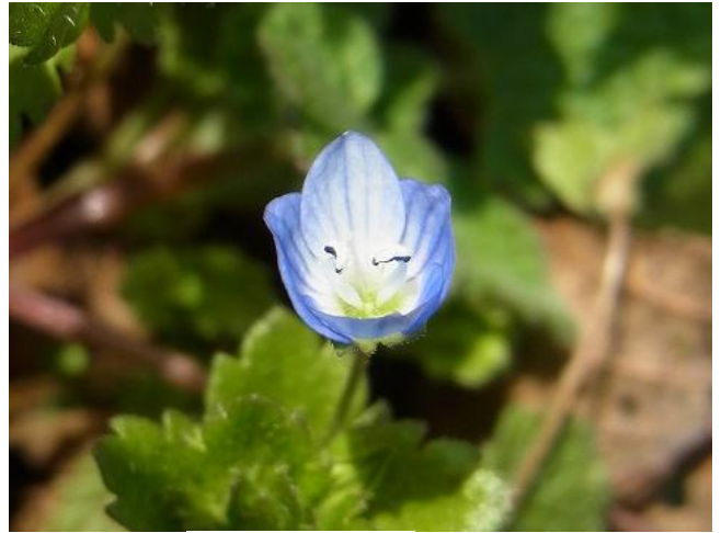
オオイヌノフグリ