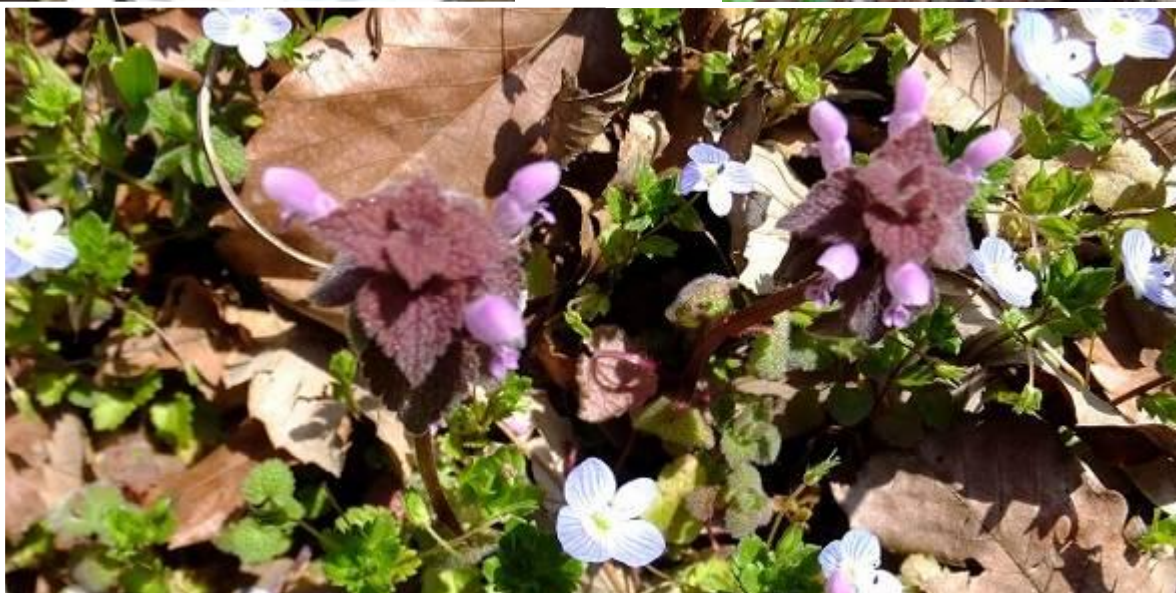
南の広場ではコバルト色のオオイヌノフグリやヒメオドリコソウが花盛り