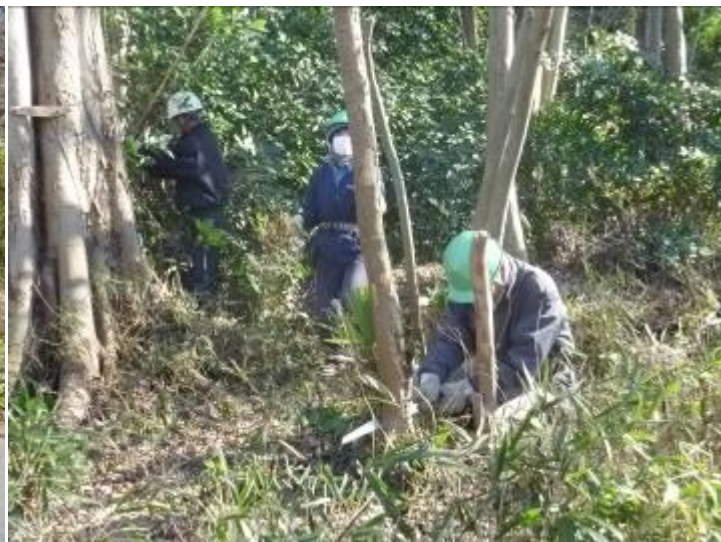
西側道路沿いの枯木を除伐