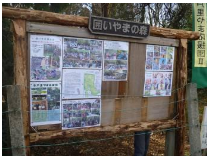
新装になった掲示板