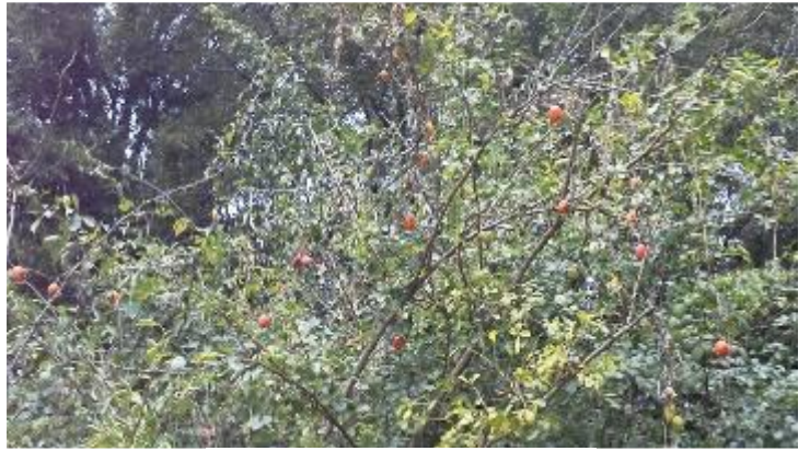
ヤマウコギにカラスウリの実