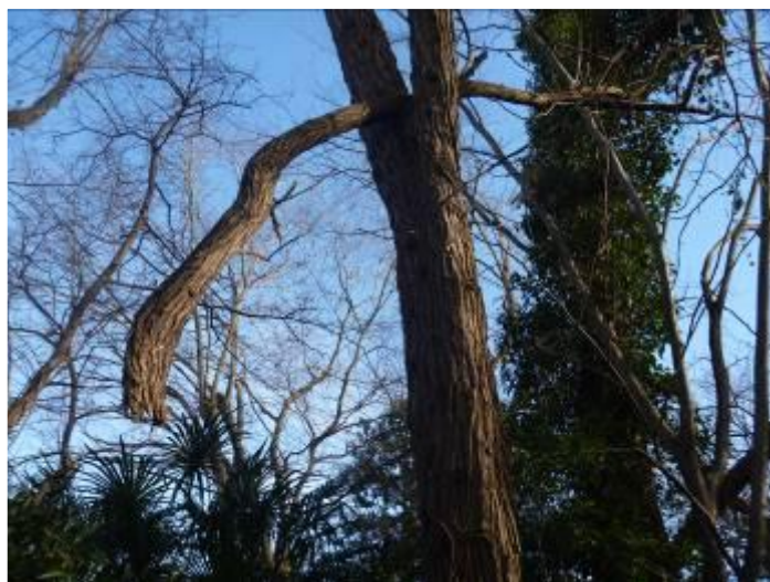
宙ぶらりんの大枝①