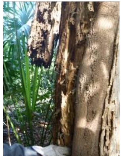
折れかかったムクノキ