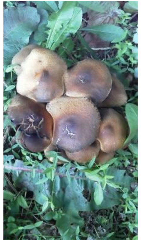
ウラムラサキシメジ?