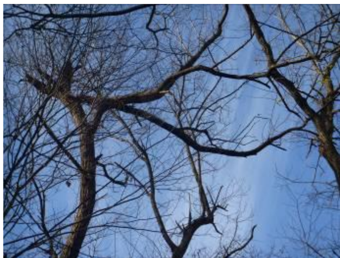
宙ぶらりんの大枝②