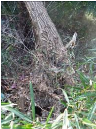
根こそぎ倒れたハリエンジュ