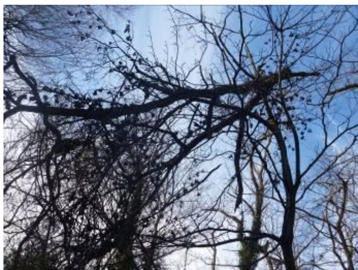
入口広場上空の架かり枝