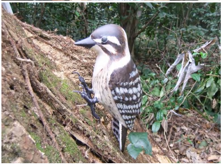
囲いやまのマスコットキャラクター：コゲラ 大