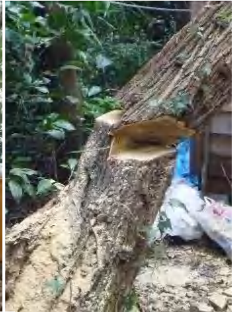
少し倒れ掛かった