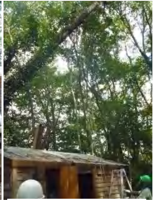
高い二股にロープを架けて