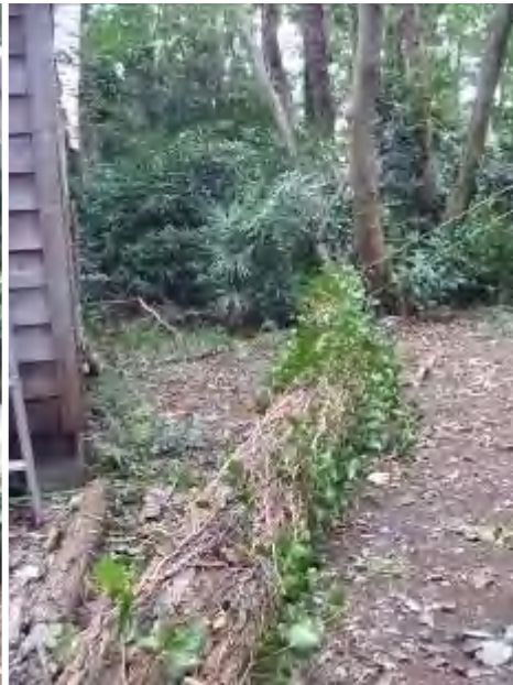
倉庫を痛めずに作業が出来ました