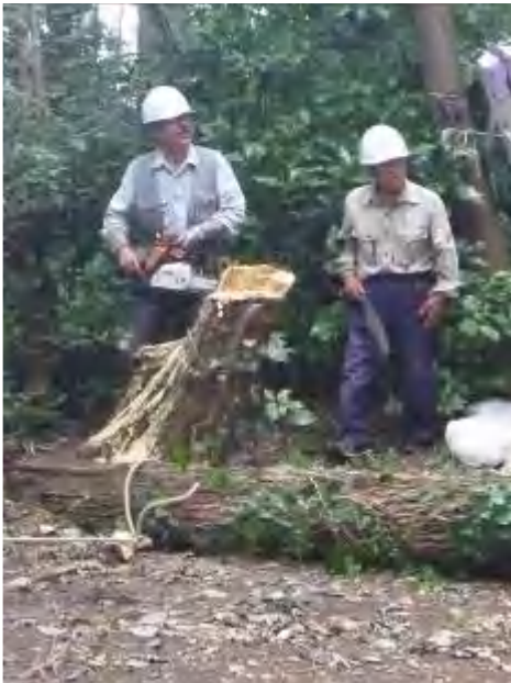
追い口の上を第2のロープで引きながら ツルを切り離して完了