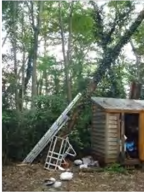
倉庫の屋根にぶつからないように脚立を支えに