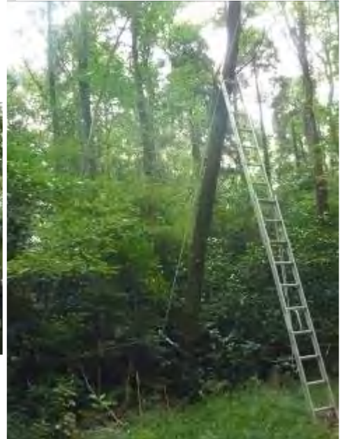
木の根元の滑車を経由してチルホールへ