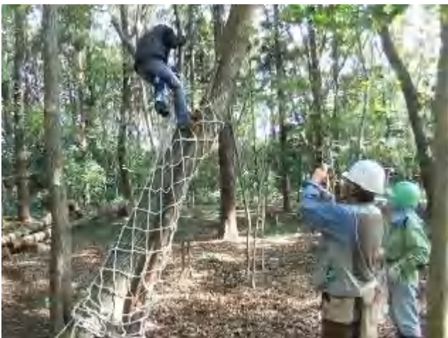
イヌシデに木登り用のネット巻きつけ

ステップアップ講座「囲いやま森の会の活動報告」：12 月 8 日（土） 10 時～15 時