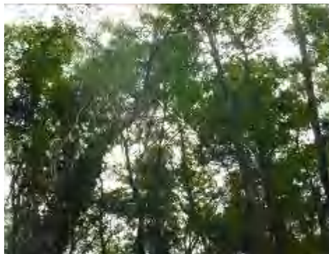
そこまでロープを引く