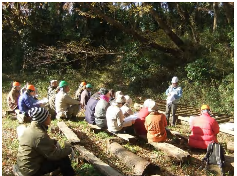
ステップアップ講座：囲いやま森の会を紹介