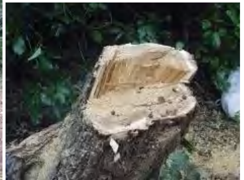
切り口はこんな形