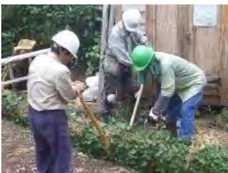
両側から鳶口で持ち上げながら玉切り