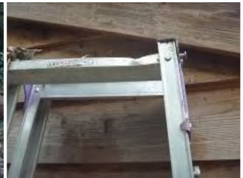
脚立が少し凹んでしまった