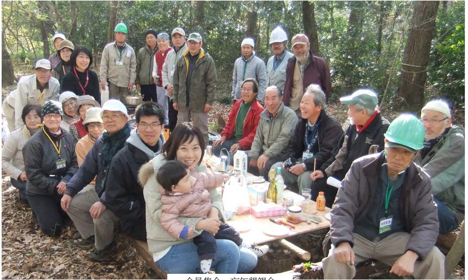
全員集合：忘年懇親会