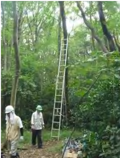
向い側の木に2連梯子ギリギリの高さに滑車を付けて～