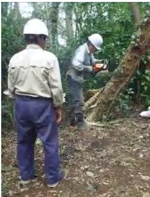
受け口の斜め切り