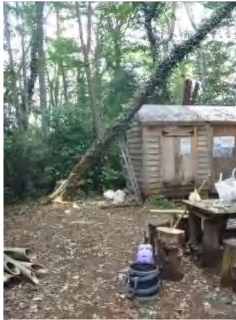
倉庫に倒れ掛かったハリエンジュ