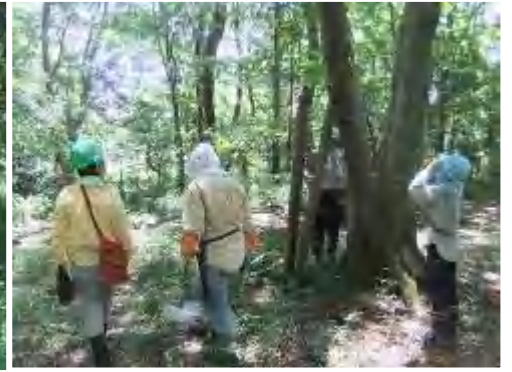
立てかけた板に虫がたくさん～