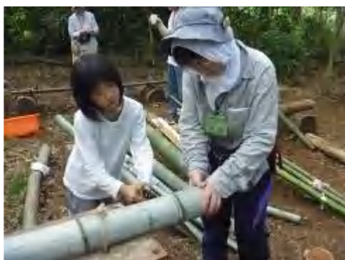
竹ノコギリで上手に切れるかな～