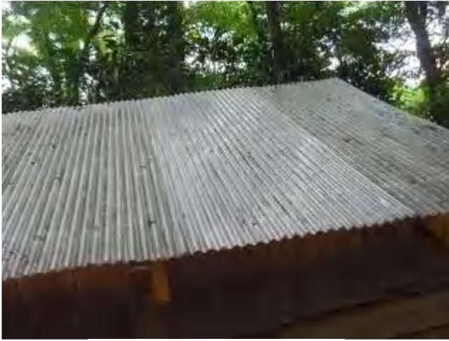
倉庫の屋根補修:波板交換