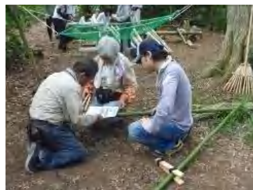
竹馬をどうやって作ろうか？