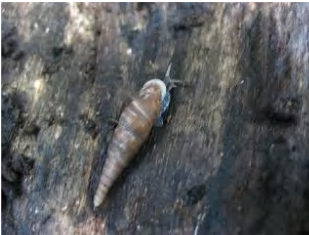
キセルガイが角を出している