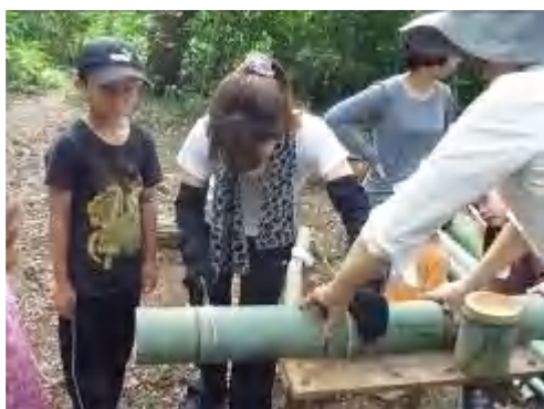
お母さんも頑張って竹切りに挑戦