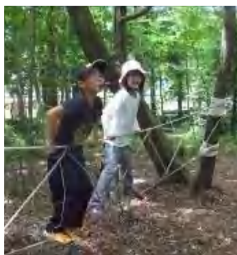
モンキーブリッジは簡単