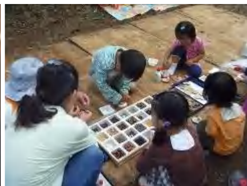
たくさんの木の实を使って制作