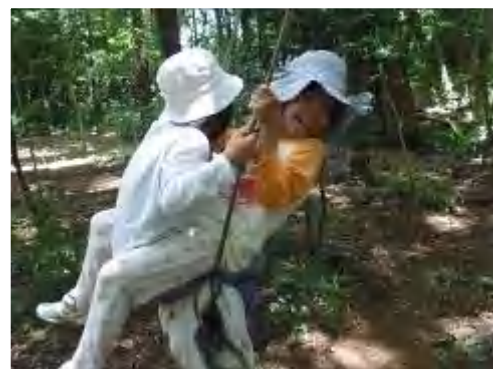
二人で乗るブランコは楽しいな～