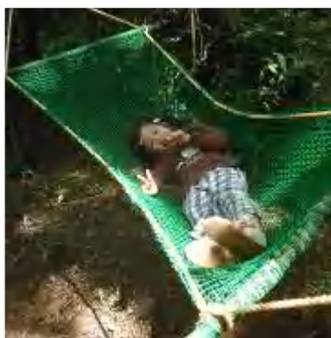
ハンモックはいい気持ち