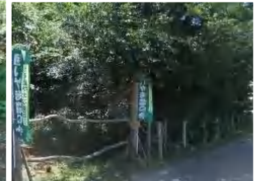
北側の通りの除草で綺麗になりました