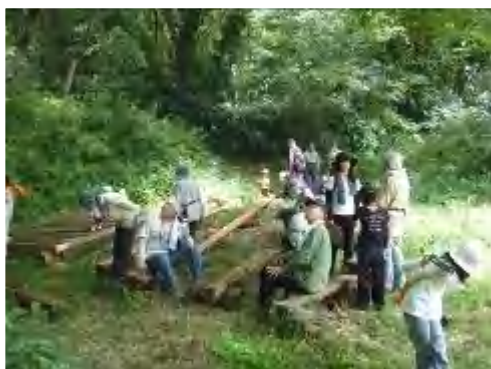
何処で鳴いているのだろう 鳥の声