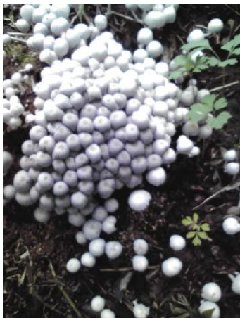
イヌセンボンタケ