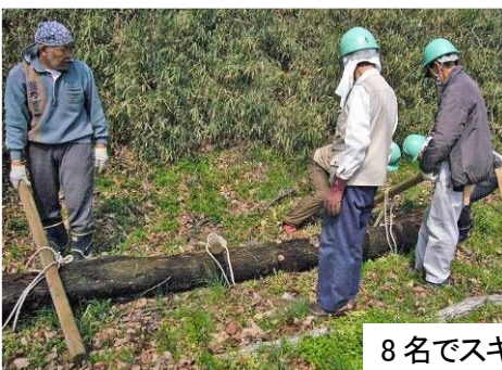
8名でスギ丸太を運搬