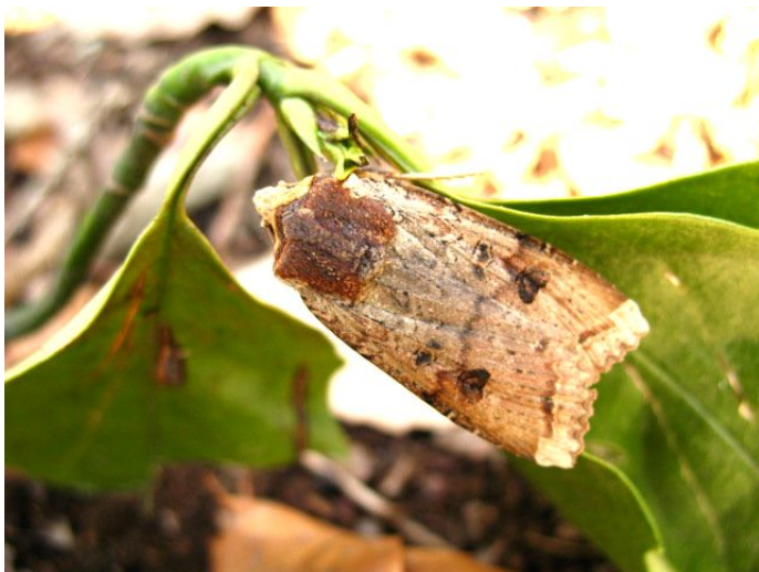
蛾(キバラモクメキリガ)