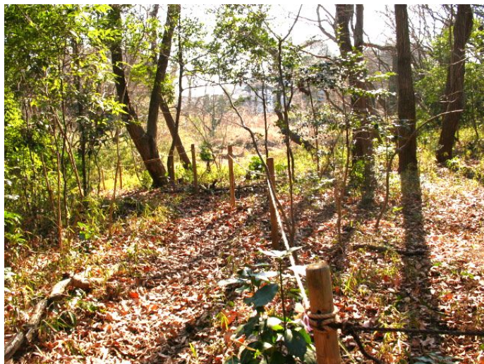
杭打ち&ロープ張り