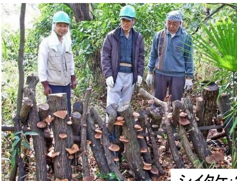
シイタケ:200ヶ キクラゲが美味しそう