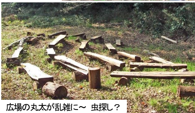
広場の丸太が乱雑に～ 虫探し？