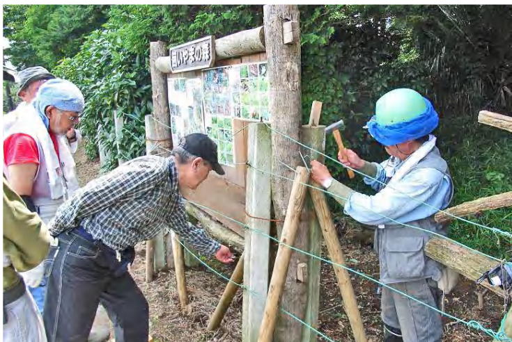
掲示板の補強作業