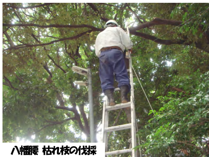
八幡腰 枯れ枝の伐採