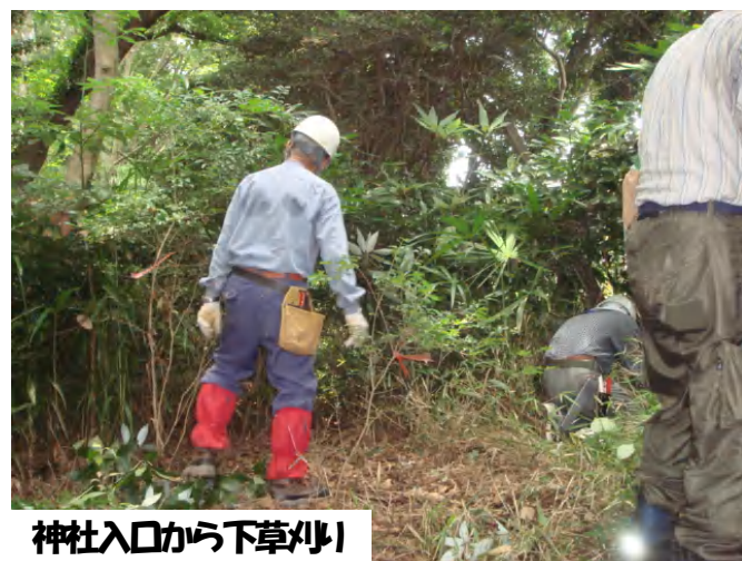
神社入口から下草刈り