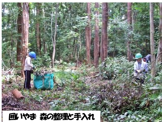
囲いやま 森の整理と手入れ

7 月 16 日(水)10～12 時 入口から 20m くらいの下草刈りと参道側に張り出しているクスノキなどの危険な枝を伐採。梯子を架けて手切りノコギリでの作業でした。里やまグループから 16 名の参加。 定例活動日は、毎月第一月曜日と第三水曜日。次回は 8 月 4 日(月) みなさんの応援をお願いします。(希望者には地図を送ります)