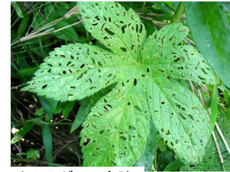
カナムグラの食跡