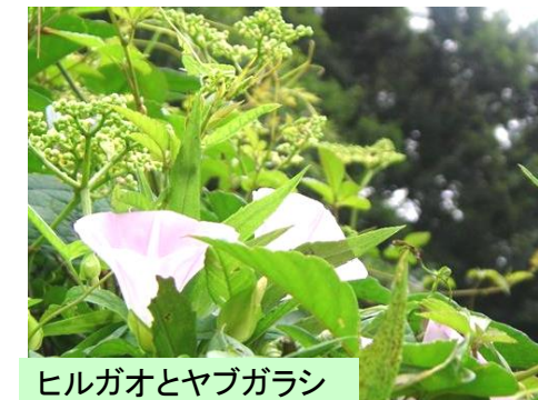
ヒルガオとヤブガラシ