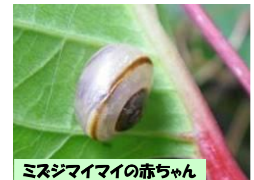
ミスジマイマイの赤ちゃん