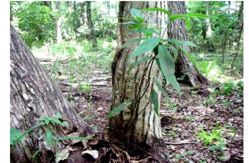
イヌシデの根元からシラカシの実生