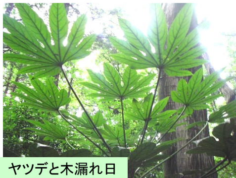
ヤツデと木漏れ日