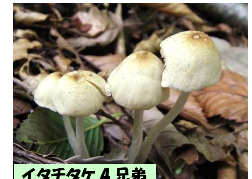
イタダケ 4 兄弟