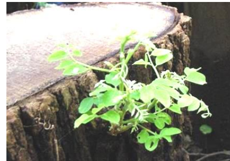
切り株からハリエンジュが～