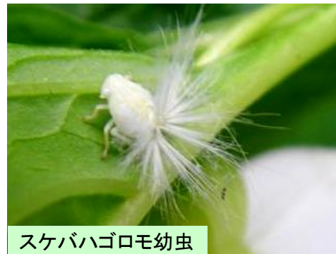
スケバハゴロモ幼虫