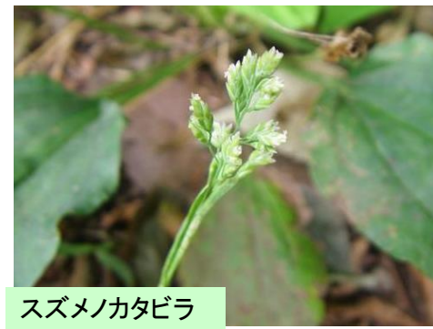
スズメノカタビラ