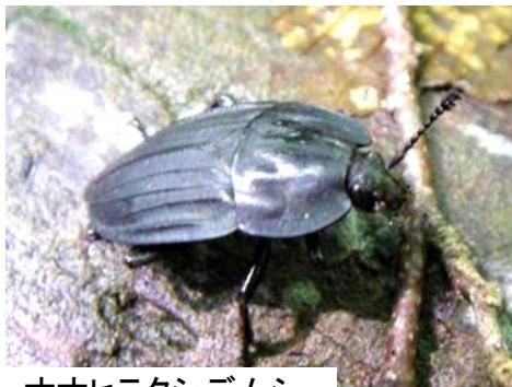
オオヒラタシデムシ