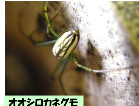
オオシロカネグモ