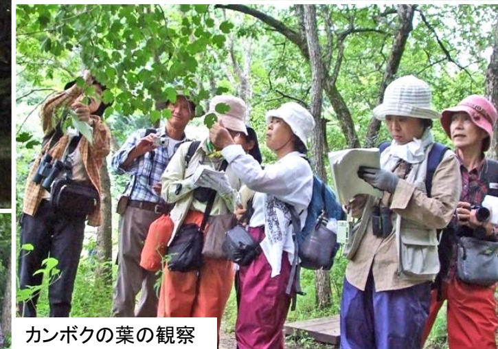
カンボクの葉の観察