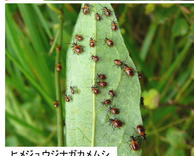
ヒメジュウジナガカメムシ