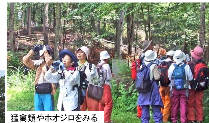
猛禽類やホオジロをみる