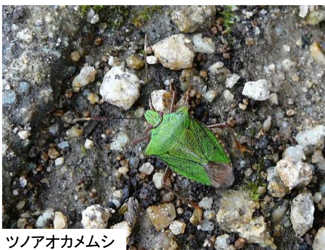
ツノアオカメムシ