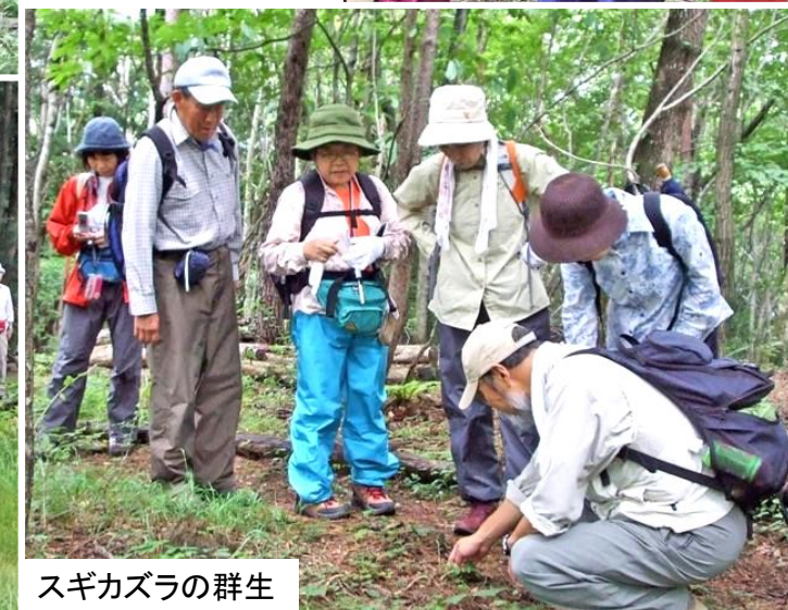
スギカズラの群生