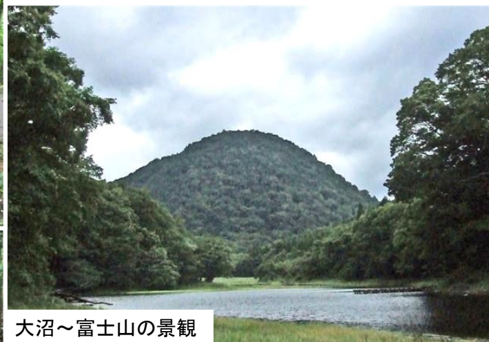
大沼～富士山の景観