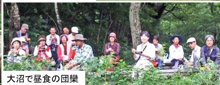
大沼で昼食の団欒