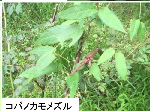
コバノカモメズル