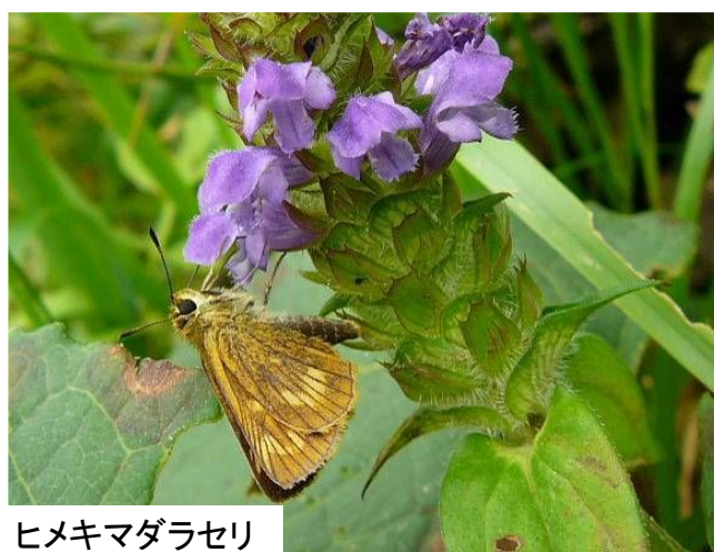
ヒメキマダラセリ