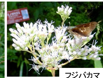
フジバカマ オミナエシ