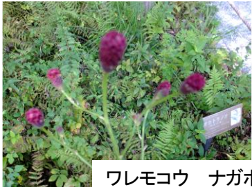
ワレモコウ ナガホノアカワレモコウ ナガホシロワレモコウ ミゾソバ