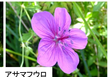
アサマフウロ サウギキョウ