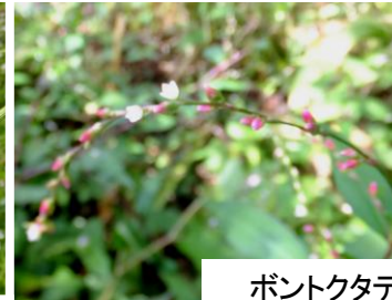
ボントクタデ サクラタデ キレンゲショウマ サギソウ