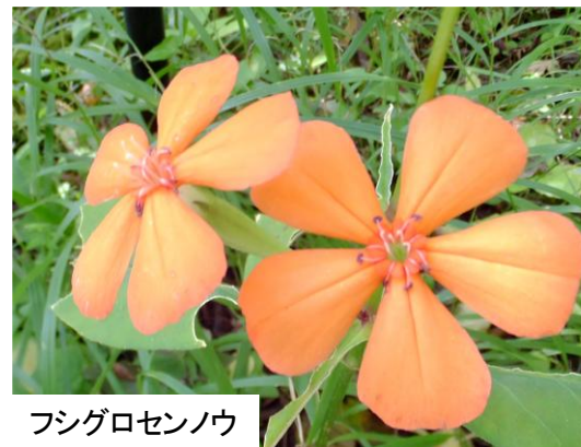
フシグロセンノウ