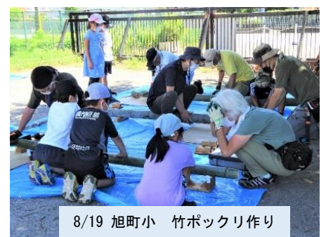
8/19 旭町小 竹ポックリ作り