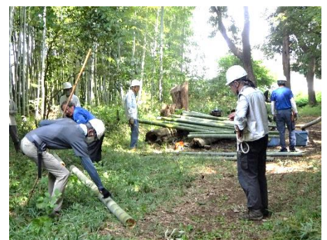
8/15 モウソウ竹の切り出し