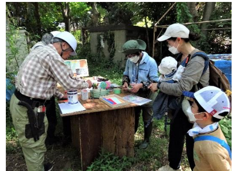
6/27 まずは短冊作りから