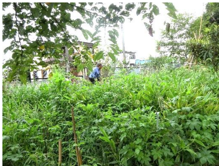
植栽域のフェンス沿い 刈込ハサミで草刈