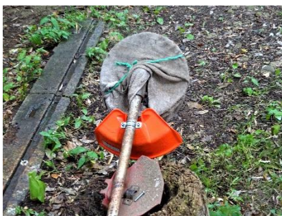
飛散防止用カバーの取り換え