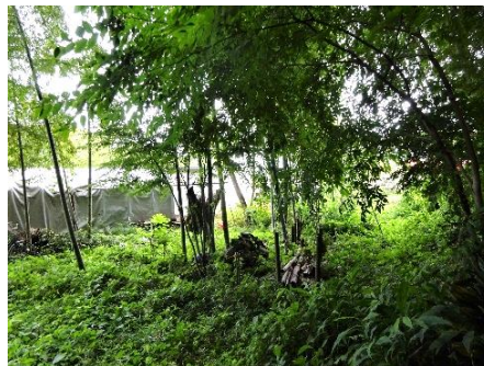
モウソウ竹伐倒(処理前:上／処理後:下)