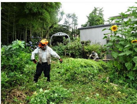
北部植栽域の草刈り