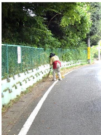
フェンス外周の清掃