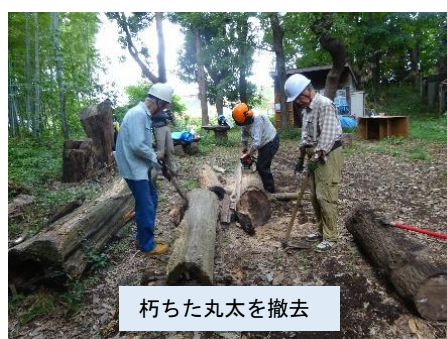
朽ちた丸太を撤去