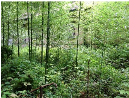
マダケの伐採(処理前:上／処理後:下)