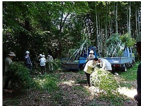
6/30 七夕プロジェクト マダケの切り出し