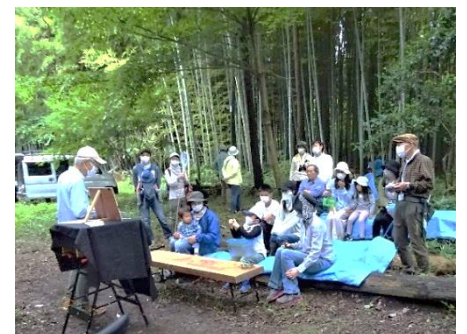
7/17 昆虫のお話しに聞き入る