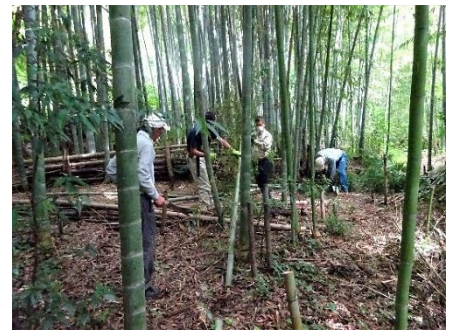
9/9 運動会用のマダケを伐倒・搬出