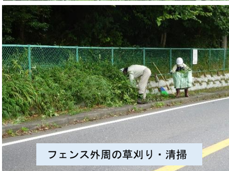
フェンス外周の草刈り・清掃