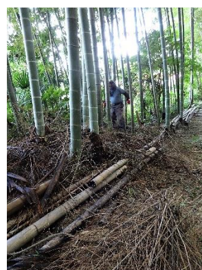
枝打ちした竹枝の整備