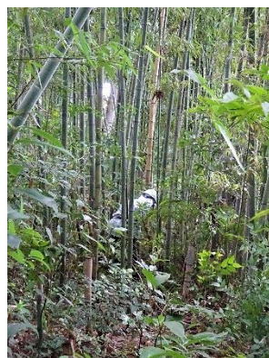
枯れた竹の伐倒処理