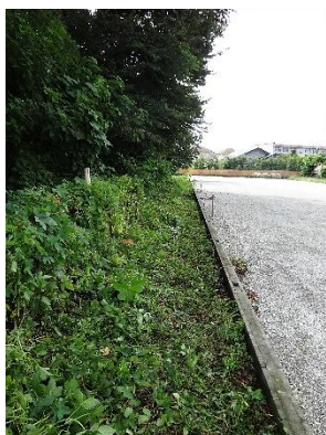
西側低地部の草刈