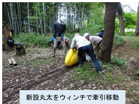
新設丸太をウィンチで牽引移動