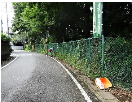
フェンス外周の清掃