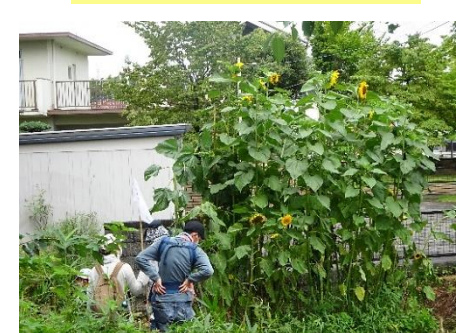
7/17 草地の中へ虫探し