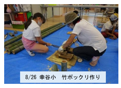
8/26 幸谷小 竹ポックリ作り