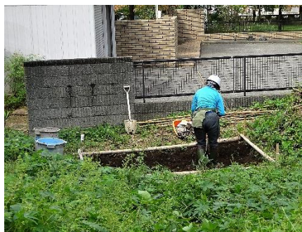
ヒマワリを撤去 次回の準備を施す