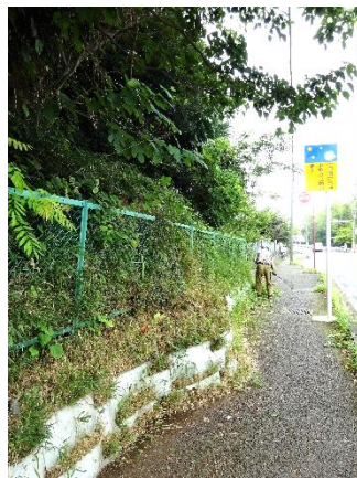
フェンス外周の草刈・清掃