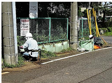
森のフェンス外周の除草・清掃