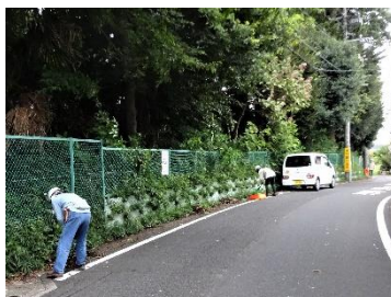
森のフェンス外周の除草・清掃