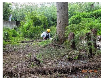
南西域のマダケの整備