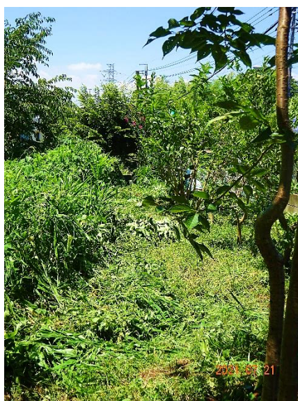
北側フェンス内の草刈り