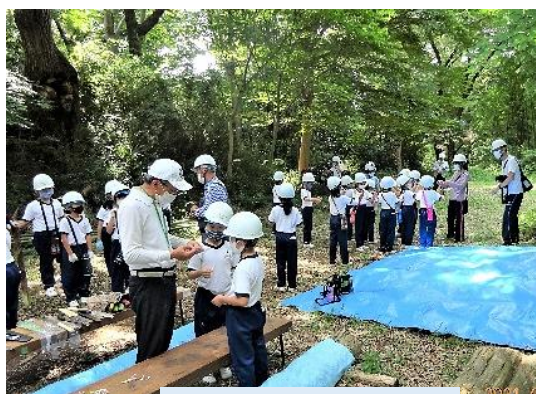
聖徳大付属小の児童の来森