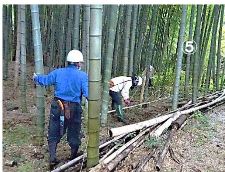
活躍塾からの参加のお二人も整備に参加