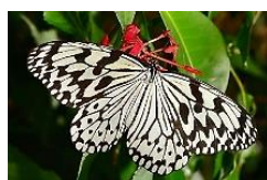
オオゴマダラの成虫