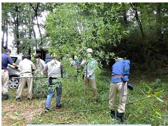
七タプロジェクト マダケの切り出し