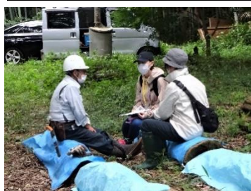
活躍塾からの参加者に活動の説明