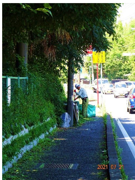
フェンスからはみ出した草の除草