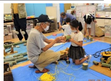
幸谷小での竹工作教室 上・下