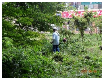
北部植生域の草刈り