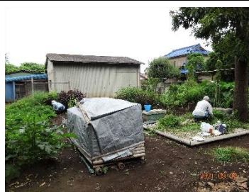
畑耕作地の手入れ作業