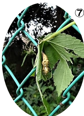
オオゴマダラのサナギ