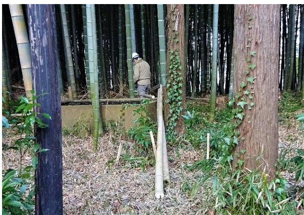
モウソウ竹林内の整備作業