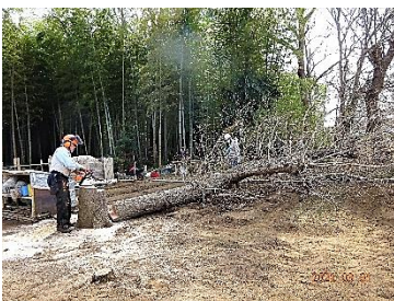
クヌギの伐倒 右上の写真：ポータブルロープウインチを使って伐倒木を移動