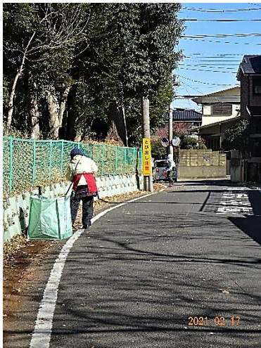
フェンス外周の落ち葉清掃