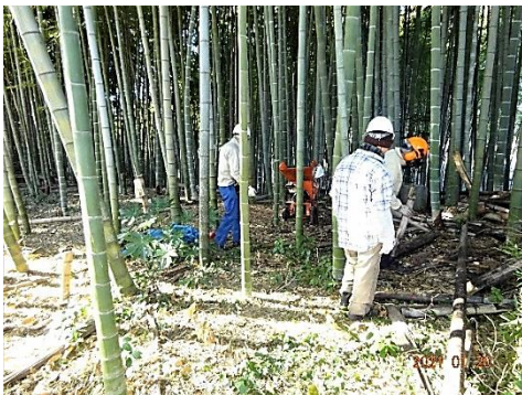
チップパーを使いモウソウ竹の粉碎作業