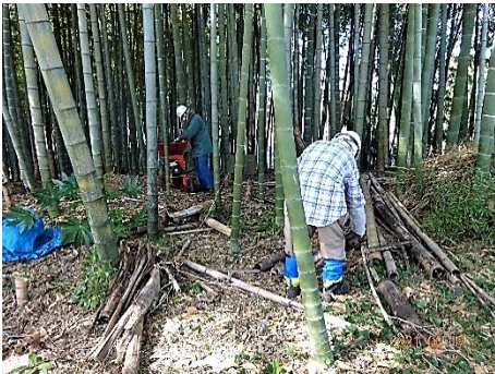
モウソウ竹のチップ作業