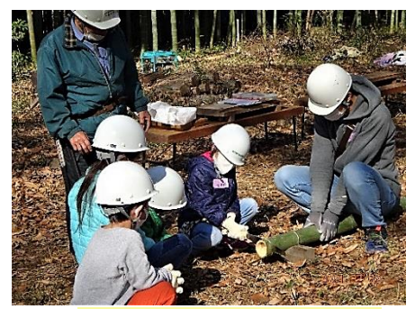
2/7 モウソウ竹の輪切りに挑戦