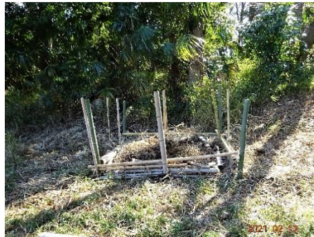
廃材竹を使いビオネスト造り