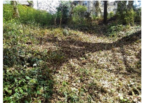
サネカズラ群生域の整備