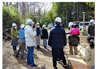
2/27 活動前のミーティング