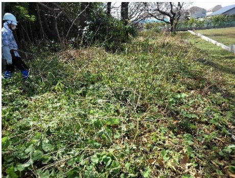
西部低地部の整備 上＝整備前・下＝整備後