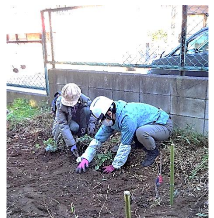
12/26 梅・アジサイ等を植栽