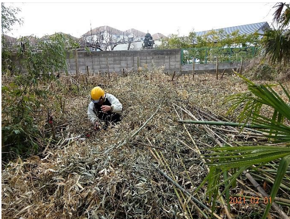
南西域 マダケの整備