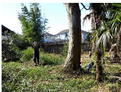
南西域 マダケの整備