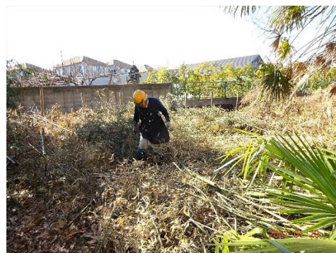
南西域 マダケの整備