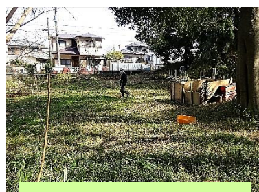
トラ刈状態だった雑草の整備