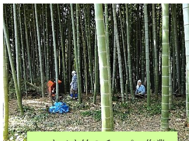
モウソウ竹のチップ作業