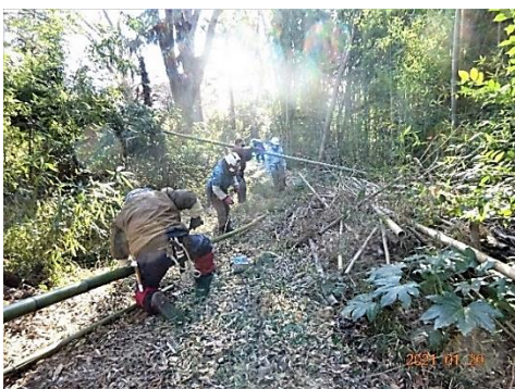
マダケの搬出準備作業