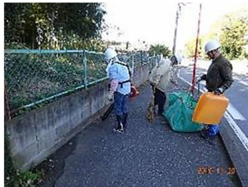
ブロワーを使って落ち葉の清掃