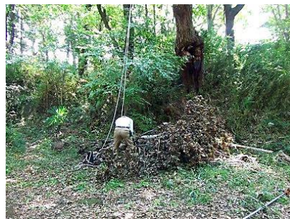
パチンコ・ロープを使って引き落した 架かり木 左の写真の赤丸部分にあった