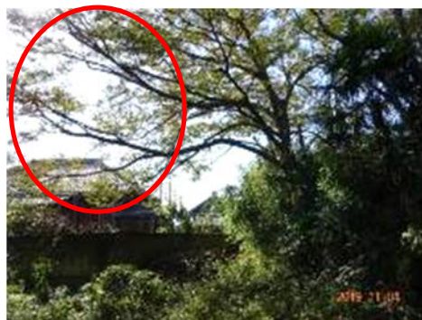
先に枝落としの要求があったケヤキ 赤丸の枝が塀を超えている