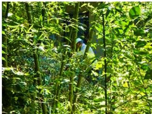
南隣家の敷地に生えたマダケの伐倒後の整理