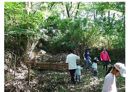
9/28 STG の森への恩返しは、 広場の落下枝の整備 拾い集めて バイオレストへ