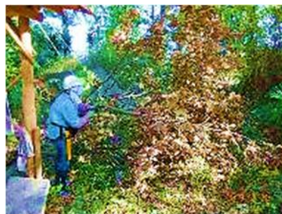
赤丸部分にある架かり木、枝周りは 20 数センチの太さ 右の写真は引き落とし後の処理作業