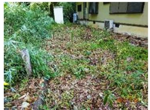
南隣家の敷地に生えたマダケを伐倒