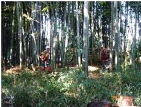
林内の伐倒竹の整理