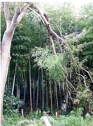
モウソウ竹を伐倒後のケヤキ