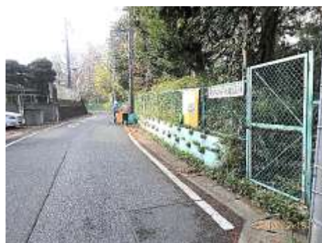
落ち葉の清掃 この時期かなりの量があった