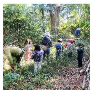
森への恩返しは 未整理の竹枝の整理