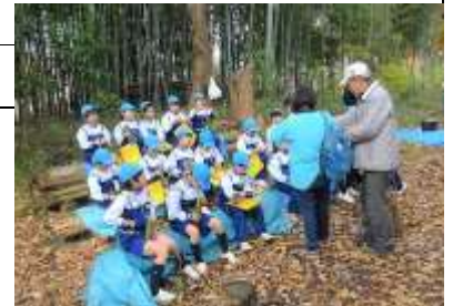
町の探検で来森した聖徳小の児童