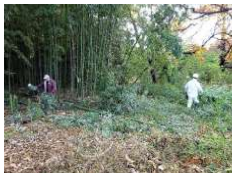
未整理だったマダケの伐倒後の整理