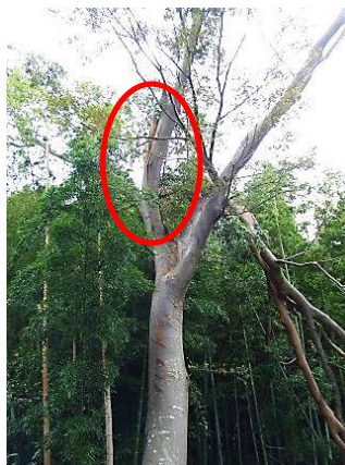
赤丸部分に新たに縦の亀裂が