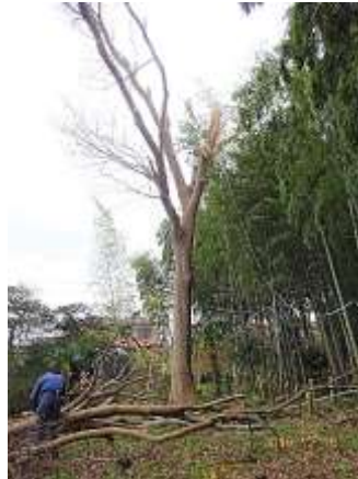
枝落とし後のケヤキ