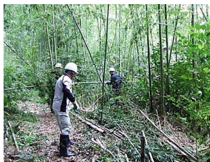
森の周囲の落ち葉の清掃、竹林内の整備と、生涯大学のみなさんが活躍