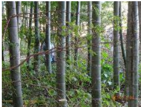
作業者の姿が見えずらくゴメン