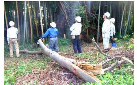
切り落とした枝 太い所は 40 cm 強 竹林内に折れ下がった枝の処理の考慮