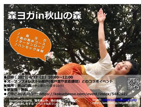
STGのイベントチラシ

秋山の森の2回目の公開日は、4月27日(土) 10時～15時 STGによる「森ヨガ in 秋山の森」が同時開催します。