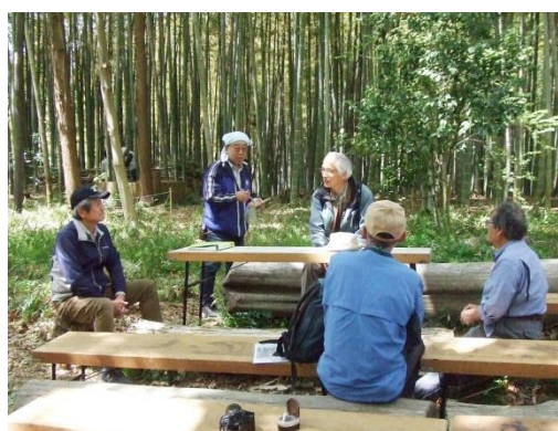
二宮さんとの話に地権者さんも同席