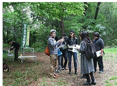
柳井先生と千葉大生