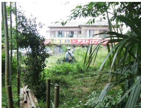
北西部域の草刈り