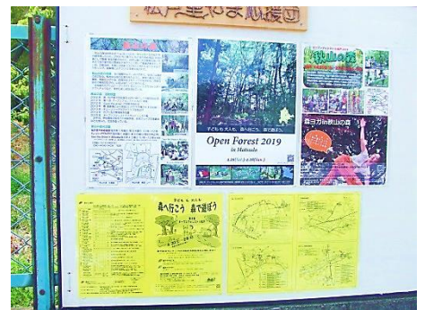
O F の P R