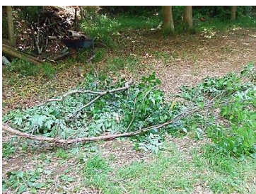
剪定した枝 作業中の写真が撮れませんでした