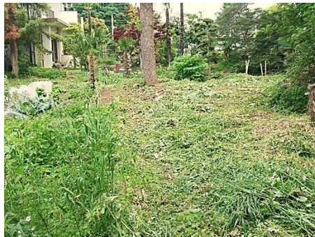
北西部域の草刈り (作業前と作業後)