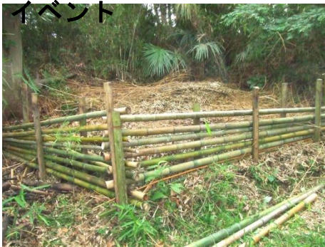
伐倒竹の整理 竹で囲い竹枝を集積