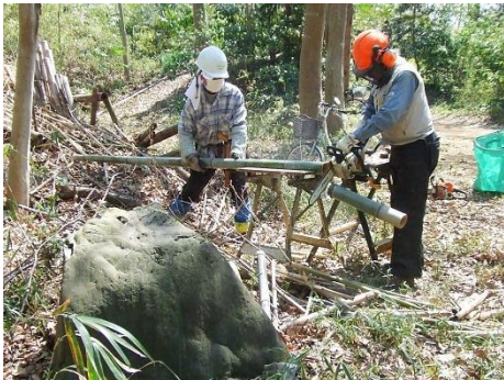
集積していた伐倒竹の整理 森の南西低地へ搬出