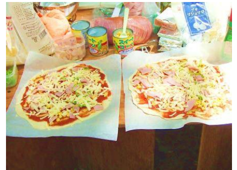
トッピング具材も多彩でした