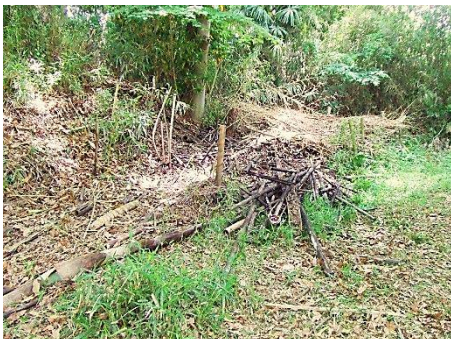
伐倒竹の整理 もうチョットです