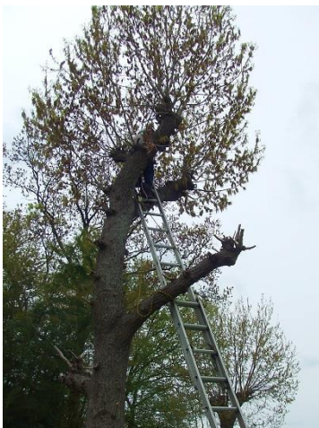
クヌギの枝落としの前後