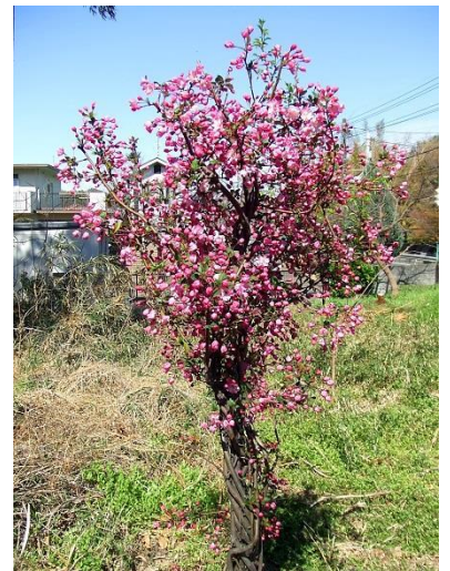
植栽したサクラ(品種は?)