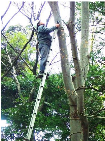
ケヤキの枯れ枝処理