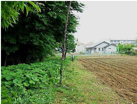
西部域 畑との境の草刈り