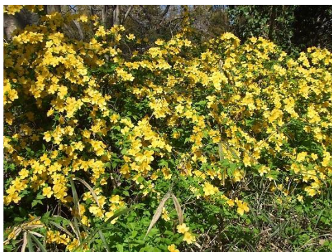
昨年より花域が広がったヤマブキ