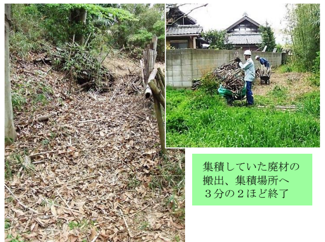
集積していた廃材の搬出、集積場所へ 3 分の 2 ほど終了