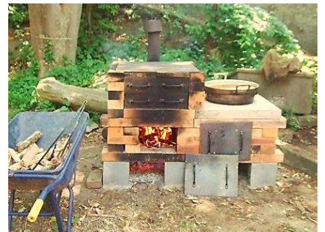
ピザ窯で 10 数枚を焼きました