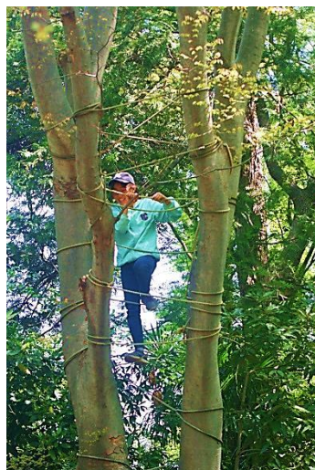
森のジャングルジム