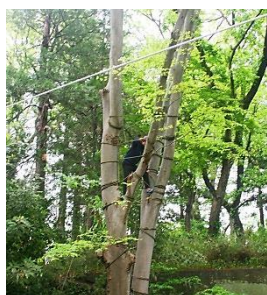
森のジャングルジム