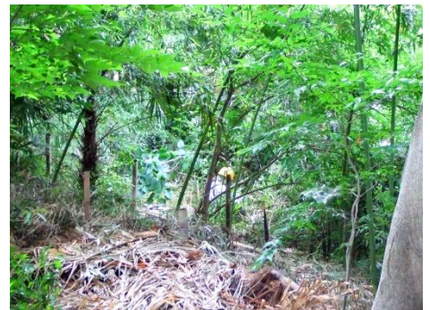
南部マダケの整備