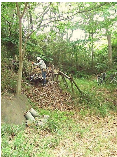
広場の隅に集積していた伐倒竹の整理