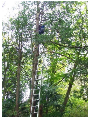
サワラの枯れ枝処理