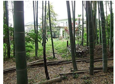
北西畑付近の整備