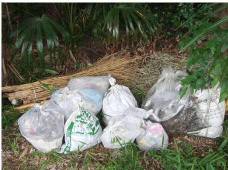
投棄ゴミを分類整理