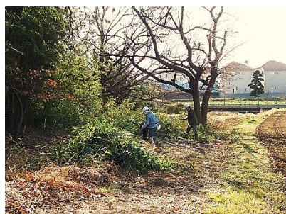
南西低地部の整備