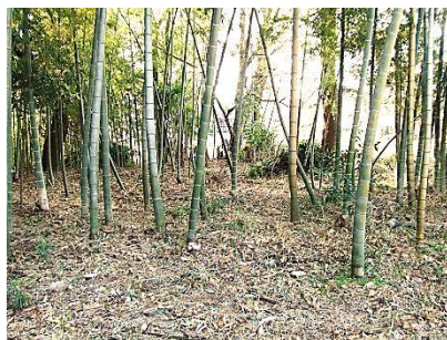
終了後 畑付近から見た画像