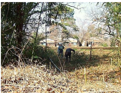
南西低地部の整備