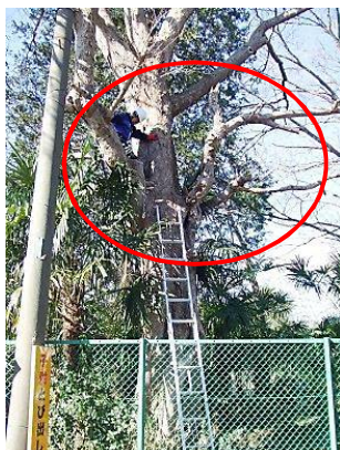
○部分に枯れ枝が3本