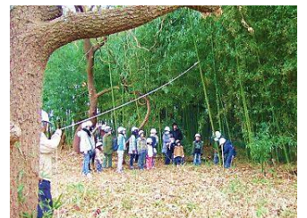
マダケの伐倒体験