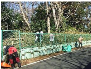
フェンス内の刈込 道路の清掃