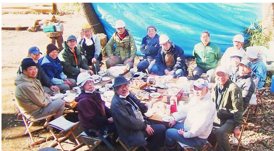
みなさん元気に参加してくれました 平均年齢もひとつ増えます！？