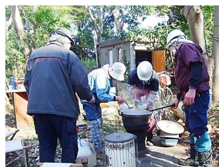
あったか鍋の仕込み