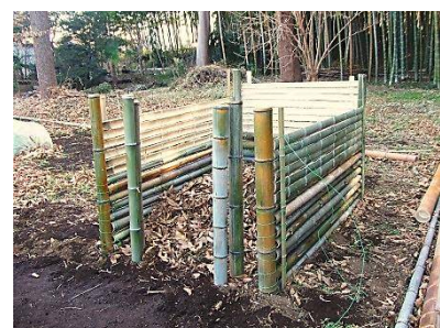
畑の堆肥作りの落ち葉の集積場