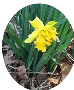
春の草花が咲き始めた