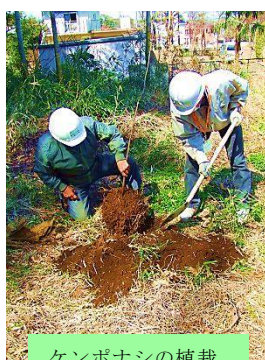
ケンボナシの植栽