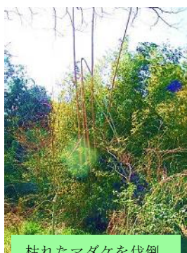
枯れたマダケを伐倒