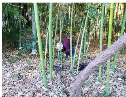
西側低地部・竹林内の整理