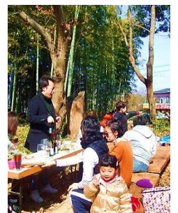
2/23 ワインでホロ酔い