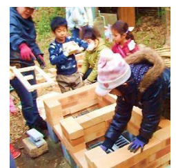
3/16 子供たちが張り切ってレンガ積み