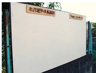
新設した広報用掲示板