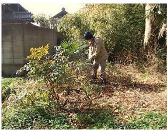
伐倒竹の集積場所の整備 右の写真は作業後