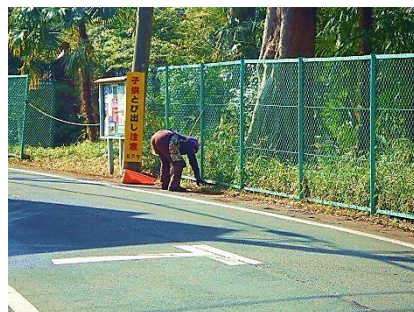
フェンス沿いの清掃