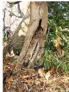
朽ちた根元 これを伐倒処理