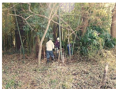
西側低地部・竹林内の整理