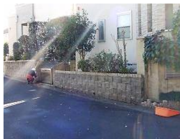
近隣の道路の清掃