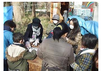
みんなでお団子作り