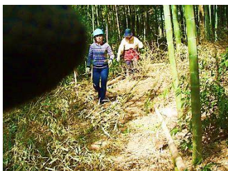
マダケの整理作業