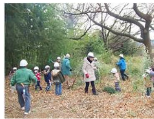
森への恩返しは 伐倒し未処理だったマダケの整理