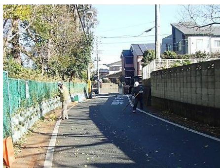
森の外周の落ち葉の清掃