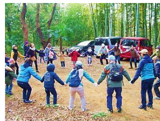
活動前に 体ほぐし