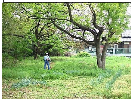
西低地部の草刈り