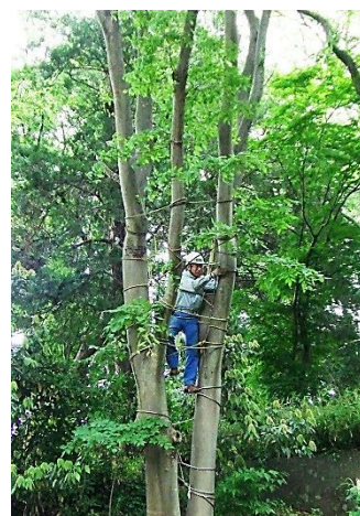
ジャングルジムの点検