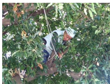
枝落としは 太い枝に登って作業