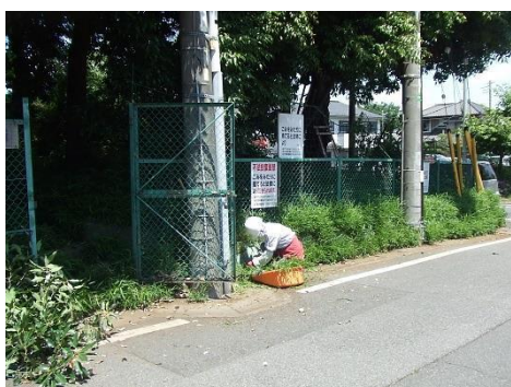
フェンス外側の除草・清掃