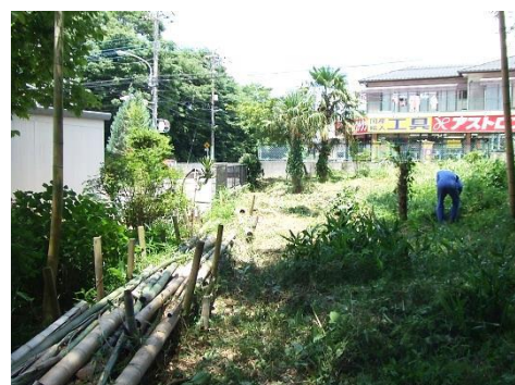
隣家との隣接域 刈払機により除草