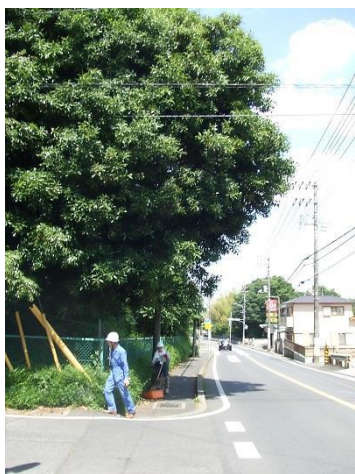
北東角の枝落とし 作業前(左)と後(右)