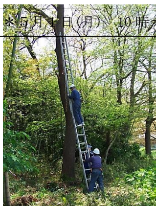
要求のあるクヌギ 枝は二連ハシゴの上部