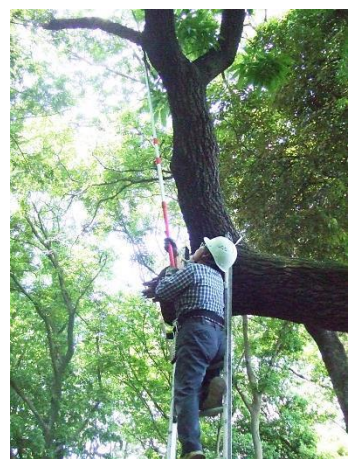
高所の枯れ枝処理