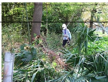
クヌギの周りの整理