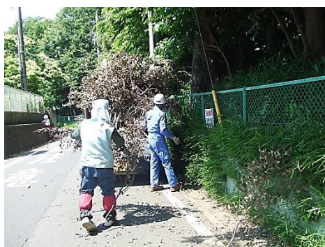
枝の搬送に軽トラックの威力はバツグン