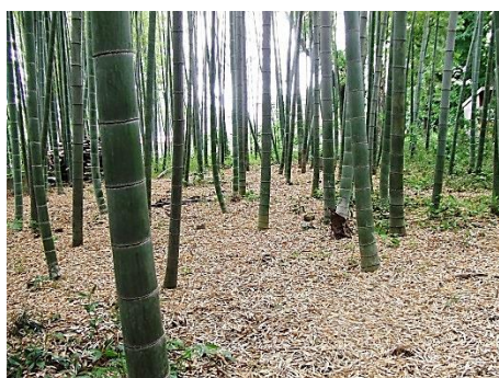
切り株を整理したモウソウ竹林