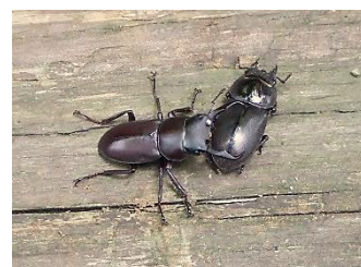
クワガタの雄と雌