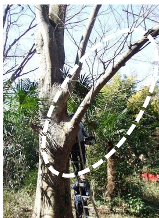
枝落したケヤキ ○印の枝