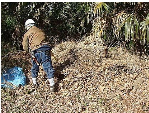
落ち葉にうもれている伐倒枝