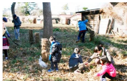
落ち葉の整理中 フキの芽を収穫