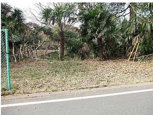
整備後の駐車スペース