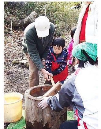
餅つきに子供も参加