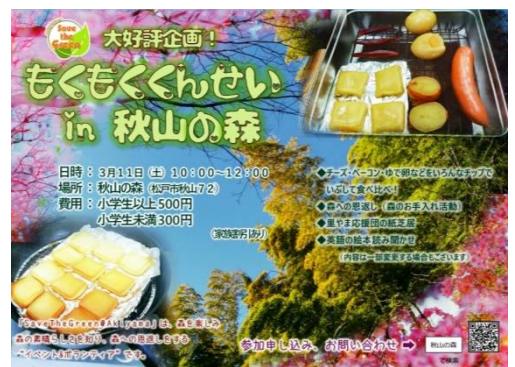
燻製作りは好評です