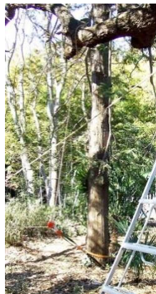
枝にロープをかけ 根本にチルホール