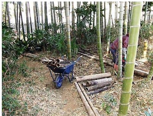
間伐モウソウチクの整理