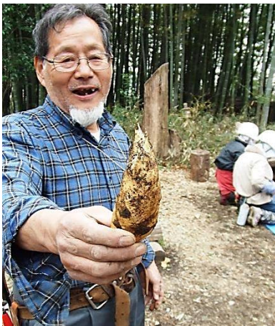
今年初物のタケノコ