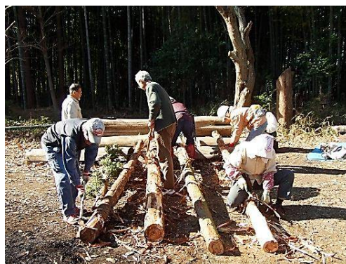
伐倒したスギの皮剥ぎ