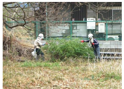
バラを囲っていたツル草などを除去