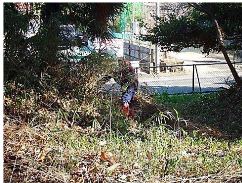
刈込んだ笹の整理