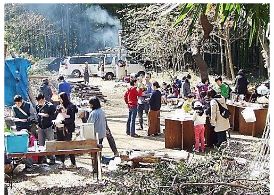
豊富な商材のくんせい、森で焙煎した珈琲 をいただきながらの歓談のひととき