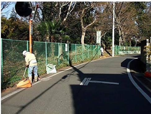
この時期恒例の落ち葉の清掃