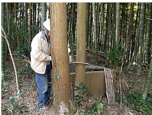
ミゾ腐れ病の枯れたスギを伐倒