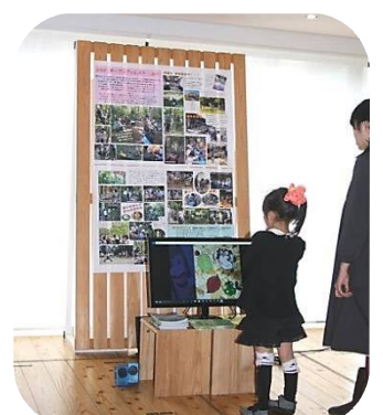
松戸里やま応援団のPRブース