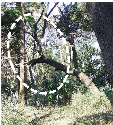
枝落したクヌギ ○印の枝