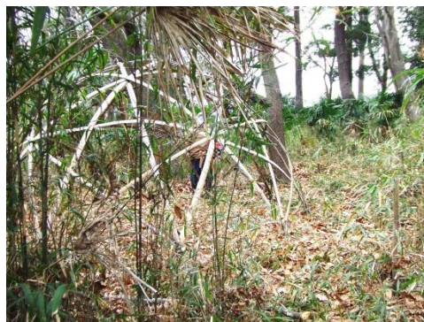
スタードームから南に向け 刈込