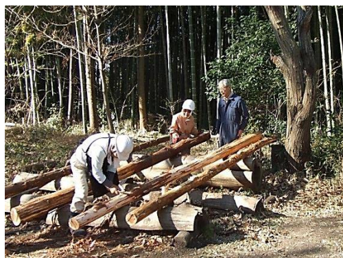
皮剥ぎは 夢中にさせます