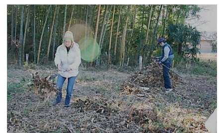
森に恩返しは落ち葉の整理