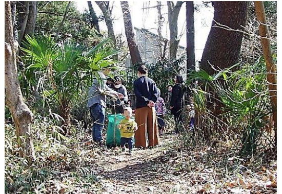
アズマネ草・落ち葉・落下枯れ枝等の整備 散策ルートがひとつ増えました