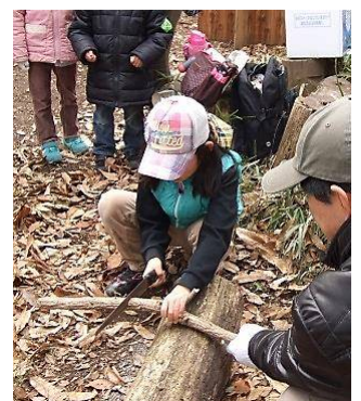
森への恩返しは薪作り