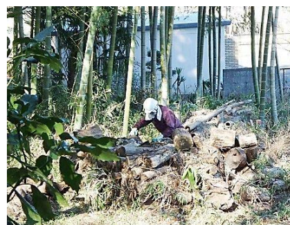
間伐モウソウチクの整理