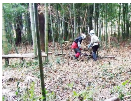
枯れ枝等を整理し 池の周りも整備