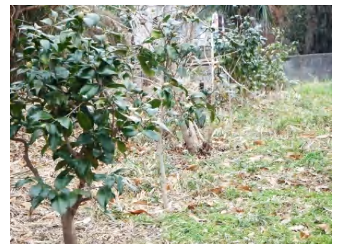
昨年植樹した間に今回植樹