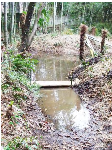
水位の多い時は水没しそうですが、他にもう 1 つ架ける予定