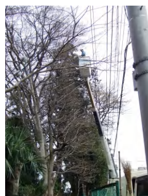
電線に架かる枝の枝打ち