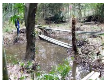
池の手入れもやり易くなりそう