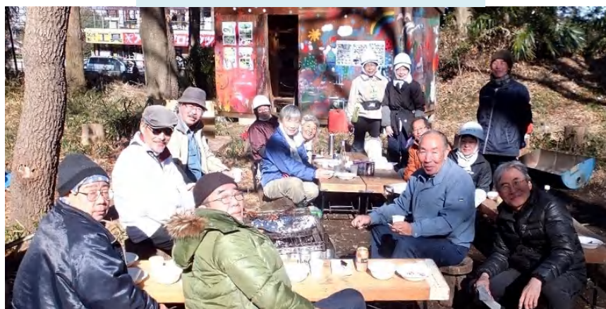
作業後、新年会を楽しみました