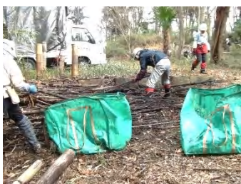
集積しておいた伐倒竹の移動が完了