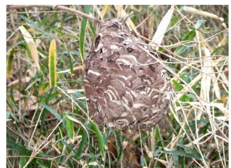
周りの葉や雑草が枯れ 見つけられた