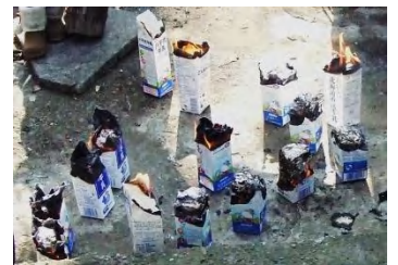
カートンドック 上手く焼けたかな