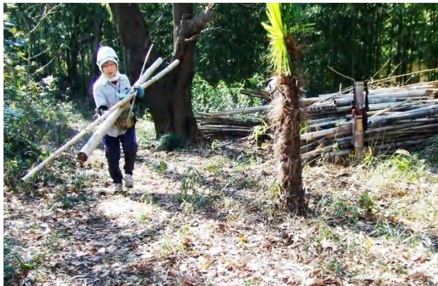
集積しておいた伐倒竹の移動