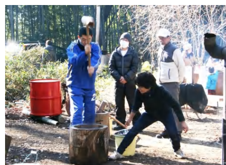
STG イベントの餅つき