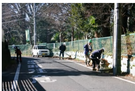
道路の清掃・北側平地の刈払い後の整備作業