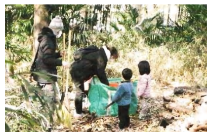
森へのお礼 親子で落ち葉の清掃 階段も綺麗に